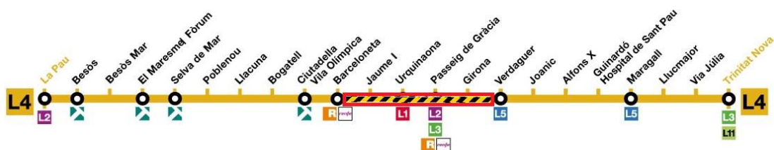
Figura 2 Esquema de Tall de L4 previst durant les obres