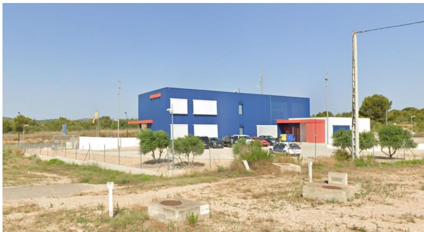
Façana posterior exterior de la Comissaria dels Mossos d'Esquadra de l'Ametlla de Mar