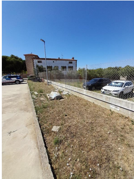
Mur posterior exterior de la Comissaria dels Mossos d'Esquadra de Roses