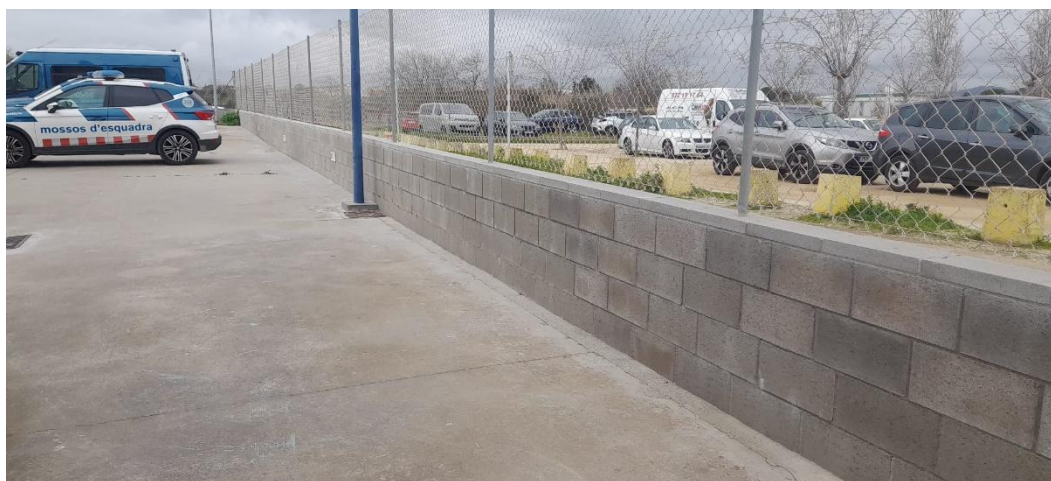
Mur posterior exterior de la Comissaria dels Mossos d'Esquadra de Roses

Degut a la urgència es va decidir actuar en la reparació del mur afectat. Actualment el mur es troba reparat, a falta de complir amb les exigències i necessitats de la tanca segons les especificacions dels Mossos d'esquadra.