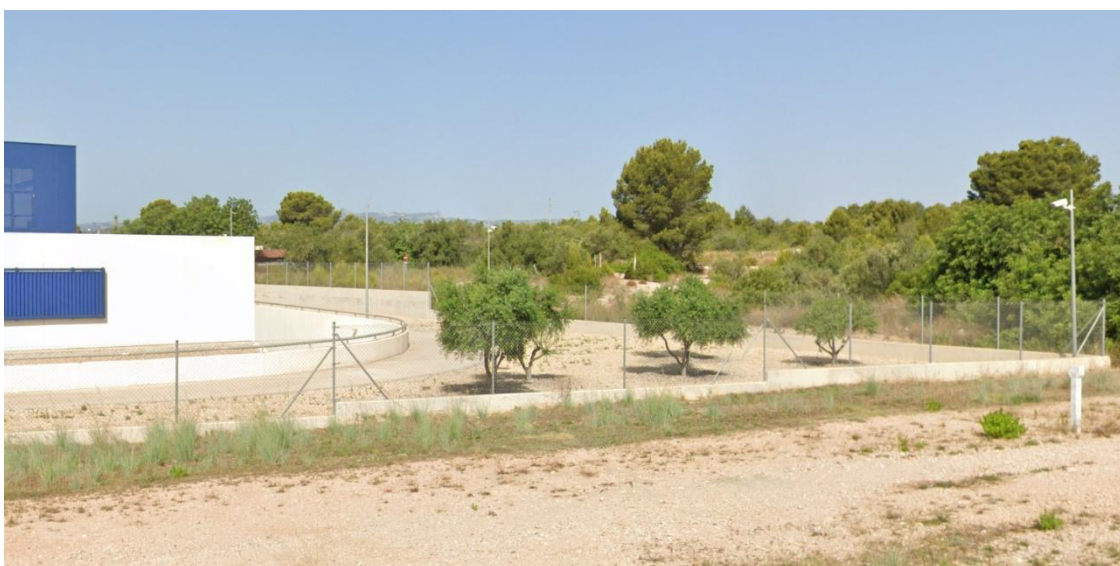
Mur posterior exterior de la Comissaria dels Mossos d'Esquadra de l'Ametlla de Mar

L'actuació es centra principalment en l'àmbit de la tanca perimetral de la comissaria, amb una longitud total de 165 metres lineals. Com s'ha justificat, l'actuació inclourà tant l'enderroc com la construcció de la nova tanca.