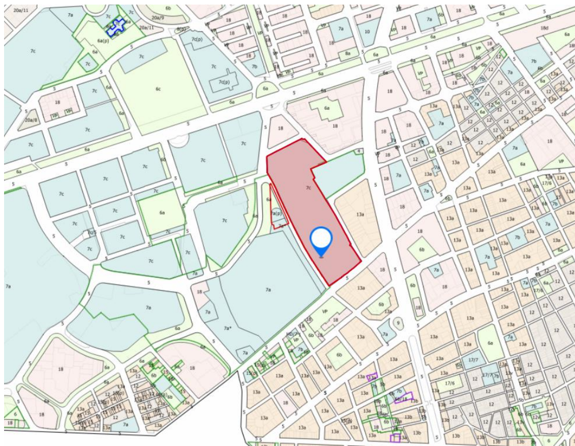
Situació de l'edifici dins el Recinte de la Maternitat.

La Casa Provincial de Maternitat i Expòsits, i el Pavelló Ave Maria al seu interior, es troba inventariat al Catàleg de Patrimoni Cultural Català com a Bé Cultural d'Interès Local (BCIL), amb número de registre 4024-I per acord de Ple de l'Ajuntament amb data de publicació de 14/08/2000, segons dades extretes del cercador d'Inventari del Patrimoni Arquitectònic de Catalunya de la Generalitat de Catalunya.