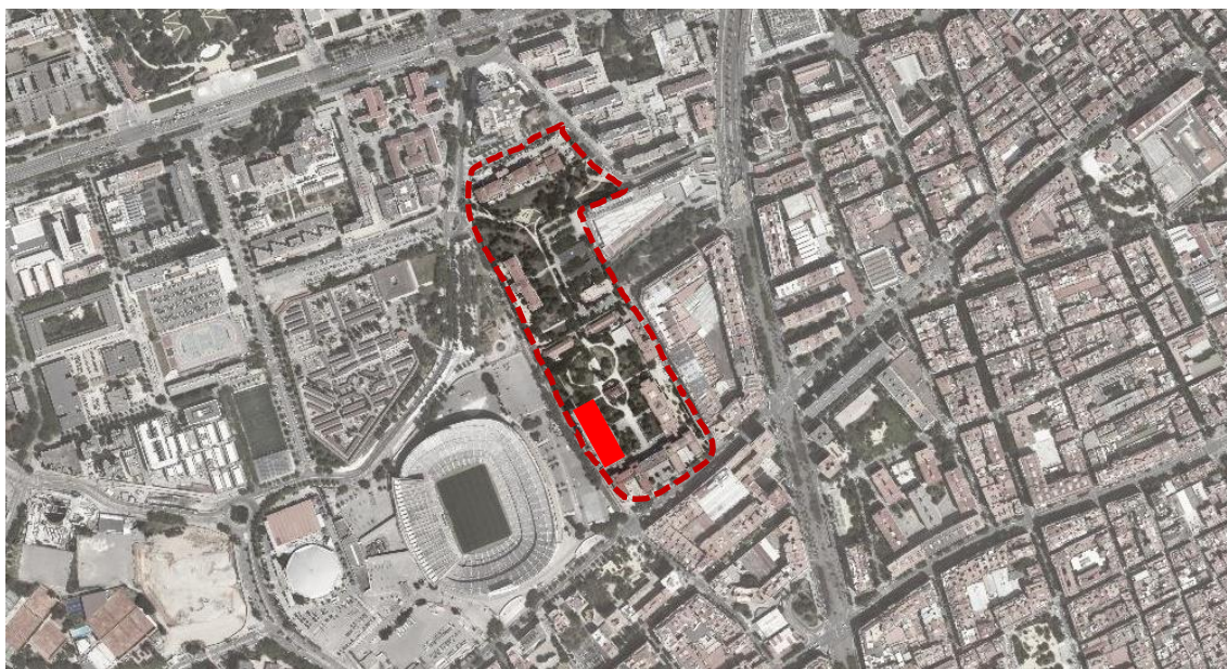
Situació del Pavelló Ave Maria dins el Recinte de la Maternitat.

L'actuació es desenvoluparà en la coberta del Pavelló Ave Maria, que és un dels edificis modernistes que pertany al Recinte de la Maternitat. Està situat a la zona sud-oest del recinte a tocar de l'edifici del Camp Nou en contacte amb el carrer d'Elisabeth Eidenbenz. Aquest pavelló actualment acull oficines del Departament de Salut de la Generalitat de Catalunya.