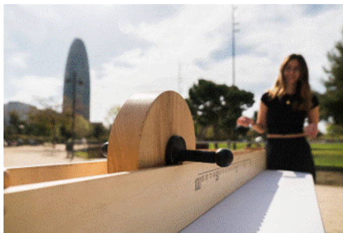
Àrea de jocs de fusta gegants