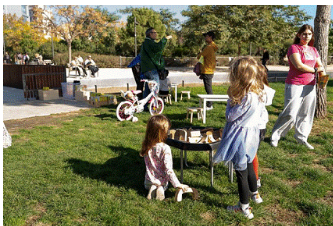
Àrea petita infància

Es preveu un aforament màxim diari de 400 persones, per tal de poder fer una bona gestió del servei.