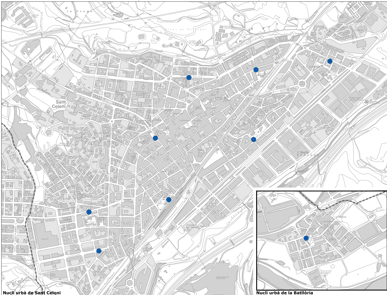
Nucli urbà de Sant Celoni