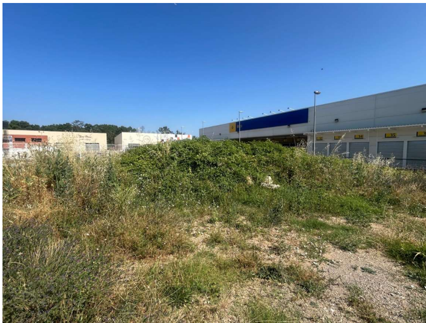
Vista de la part central del solar