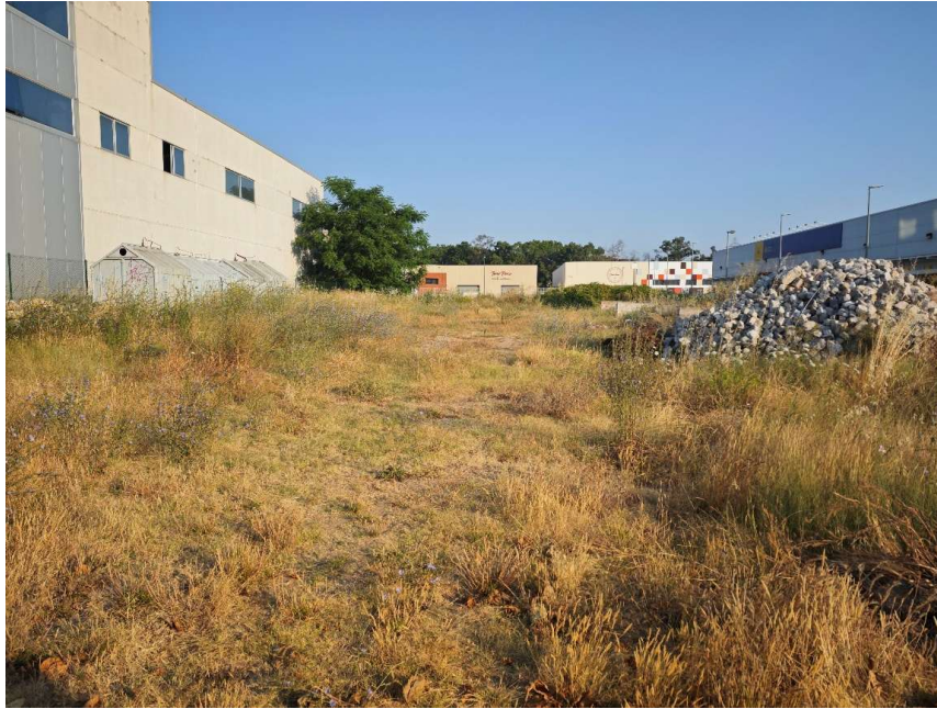
Vista general de la part del solar c/ Indústria que s'utilitza com a zona d'emmagatzematge de les Brigades Municipals