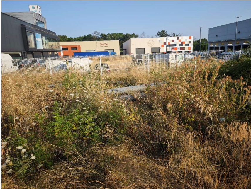
Tanca de la part del solar a retirar