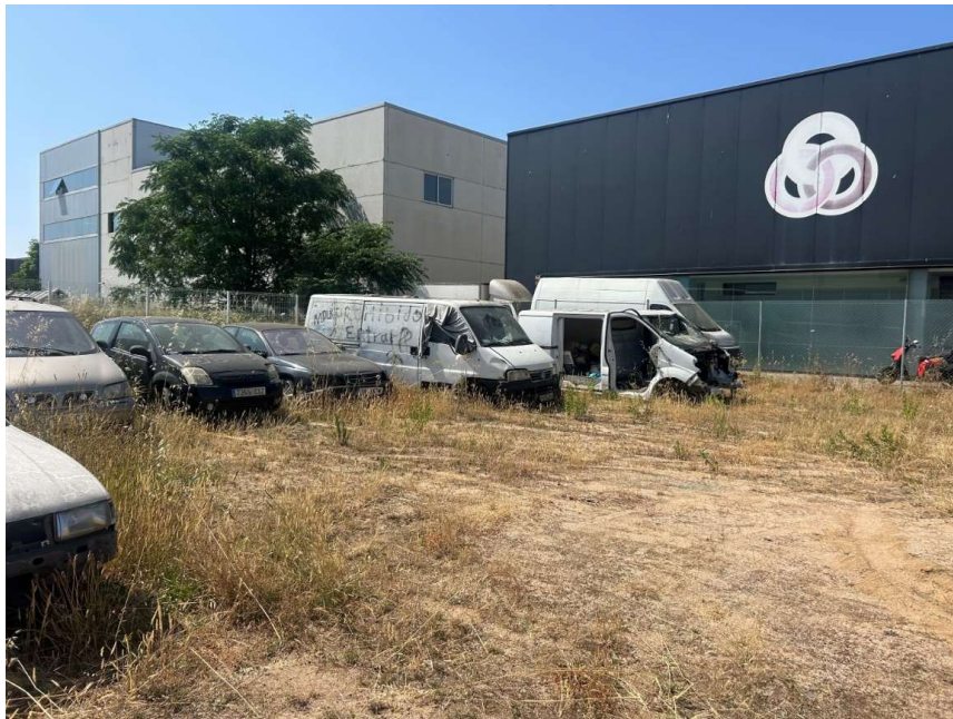
Part del solar del c/ Can Pau Birol que s'utilitza actualment pel dipòsit de vehicles