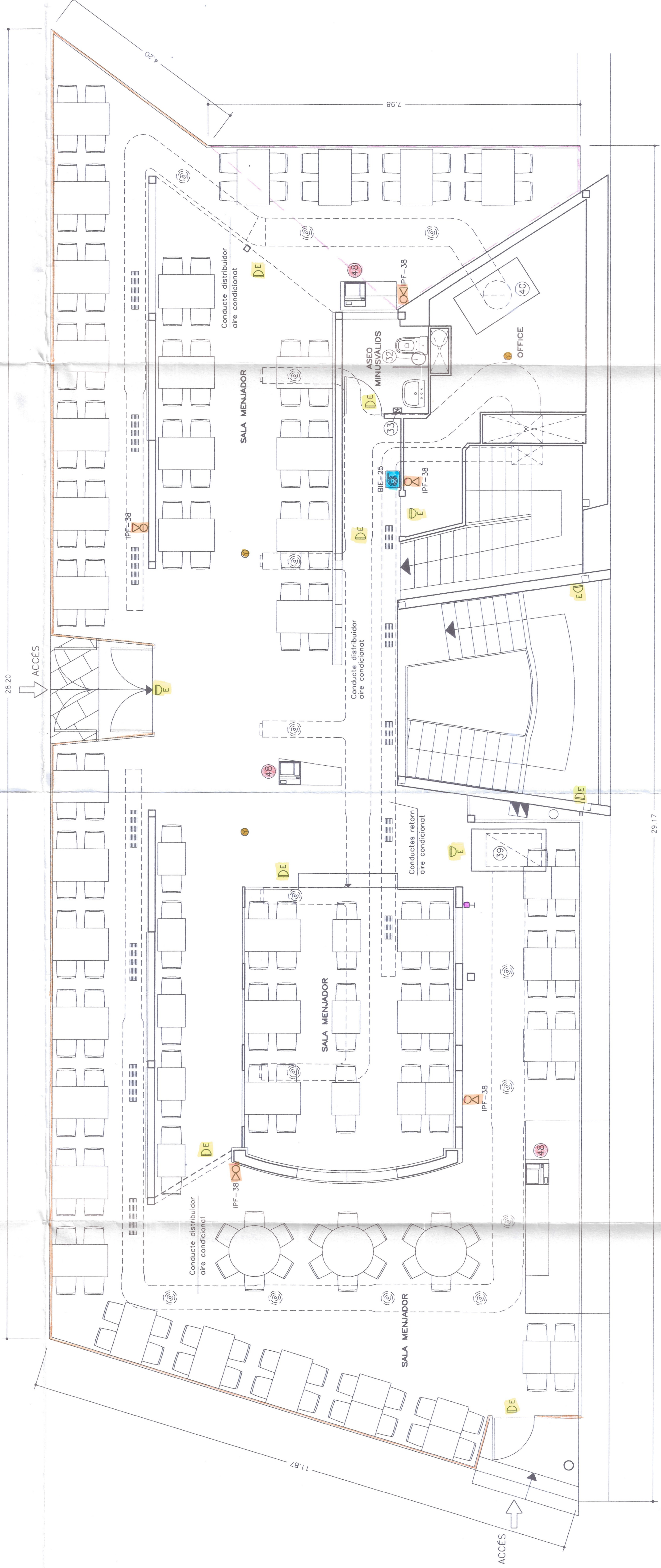
PLANTA SUPERIOR Esc. 1:50