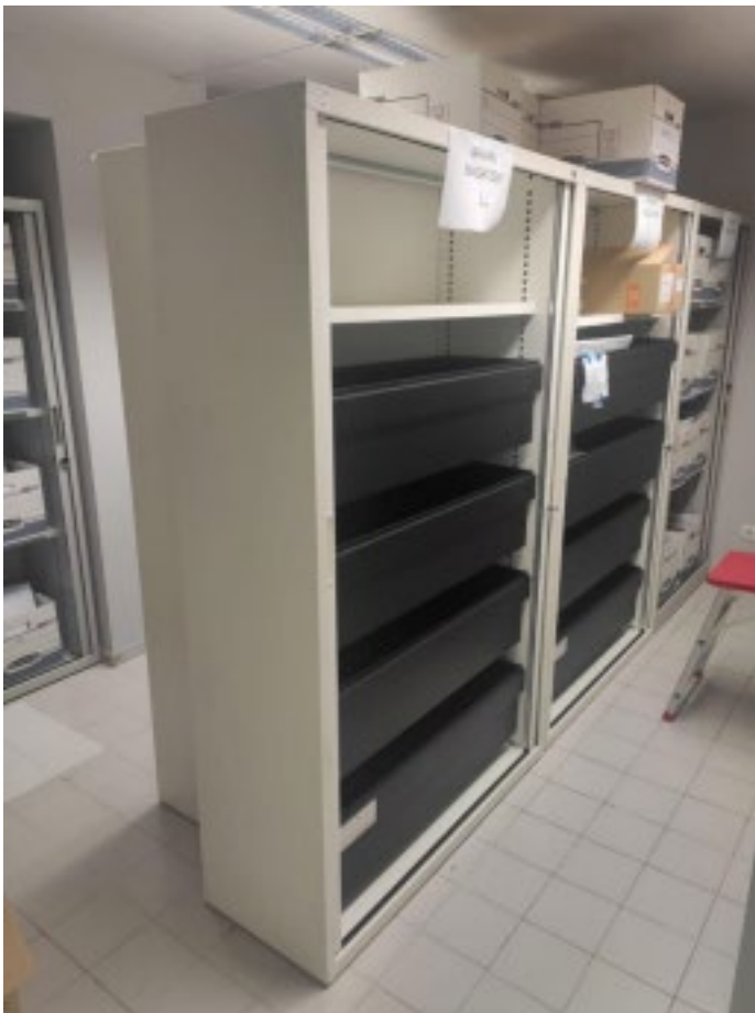
Vista general espai d'emmagatzematge SET històrics