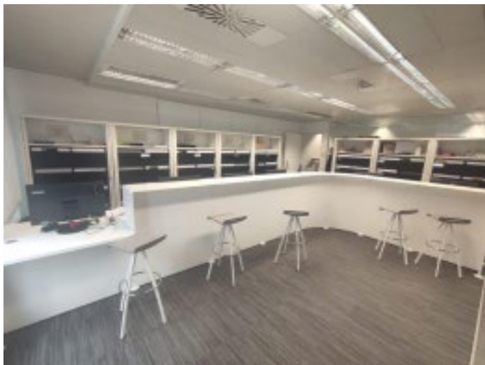
Vista general espai d'entrega de títols oficials i SET