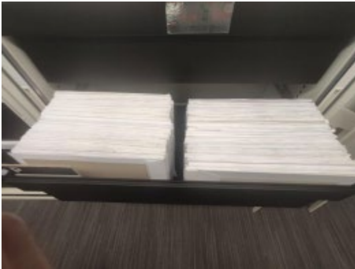
Vista detall arxivador títols universitaris oficials