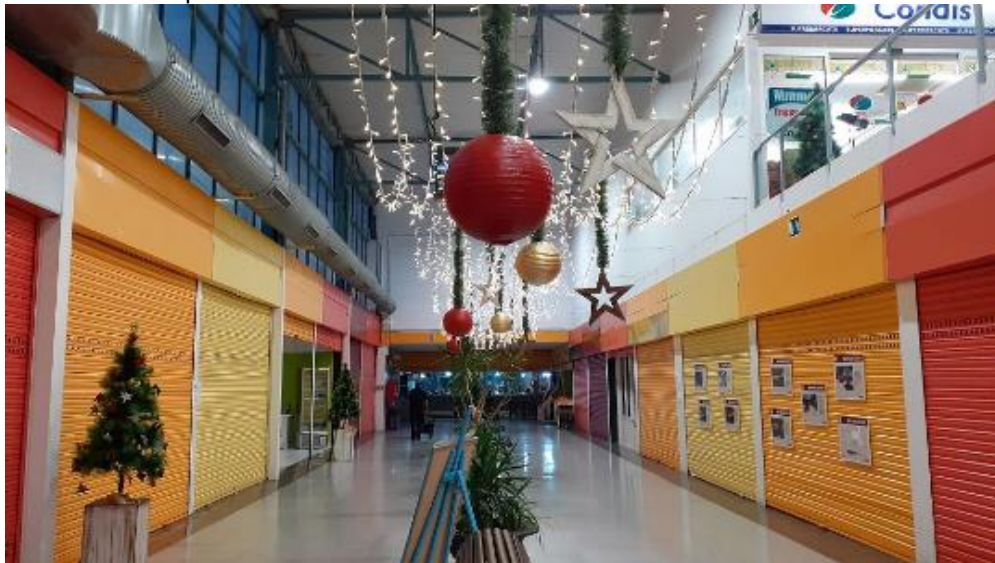
Exemple d'instal·lació lumínica a l'interior del Mercat Els Merinals