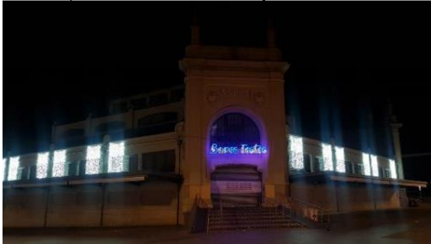
Exemple d'instal·lació lumínica a la façana del Mercat Central