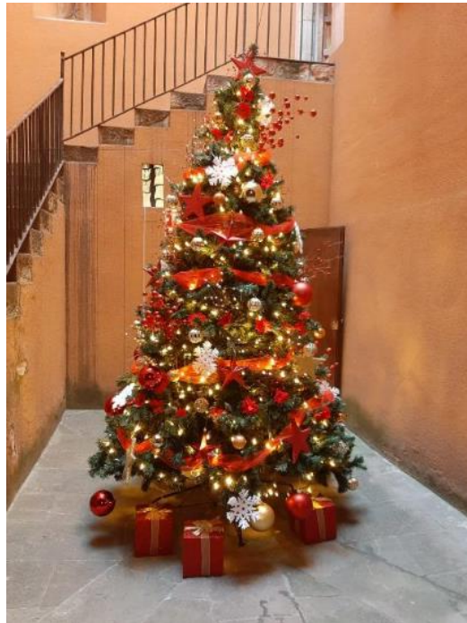
Exemple d'instal·lació d'arbre de Nadal de 3 metres a la Casa Duran