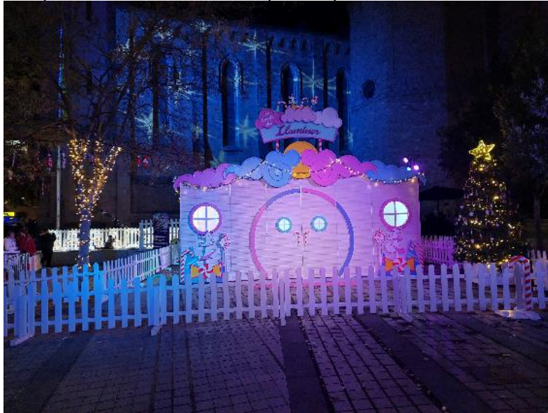
Exemple d'instal·lació de les tanques de perímetre de la Caseta del Llaminer