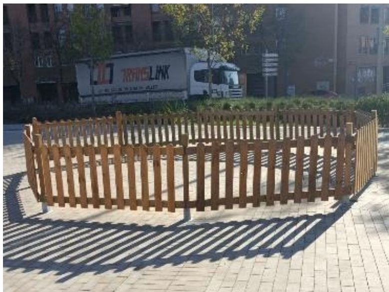
Exemples d'instal·lació de tanques de fusta per a l'arbre de la plaça de Còrdova