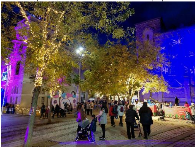
Exemple instal·lació lumínica d'arbres de l'espai públic