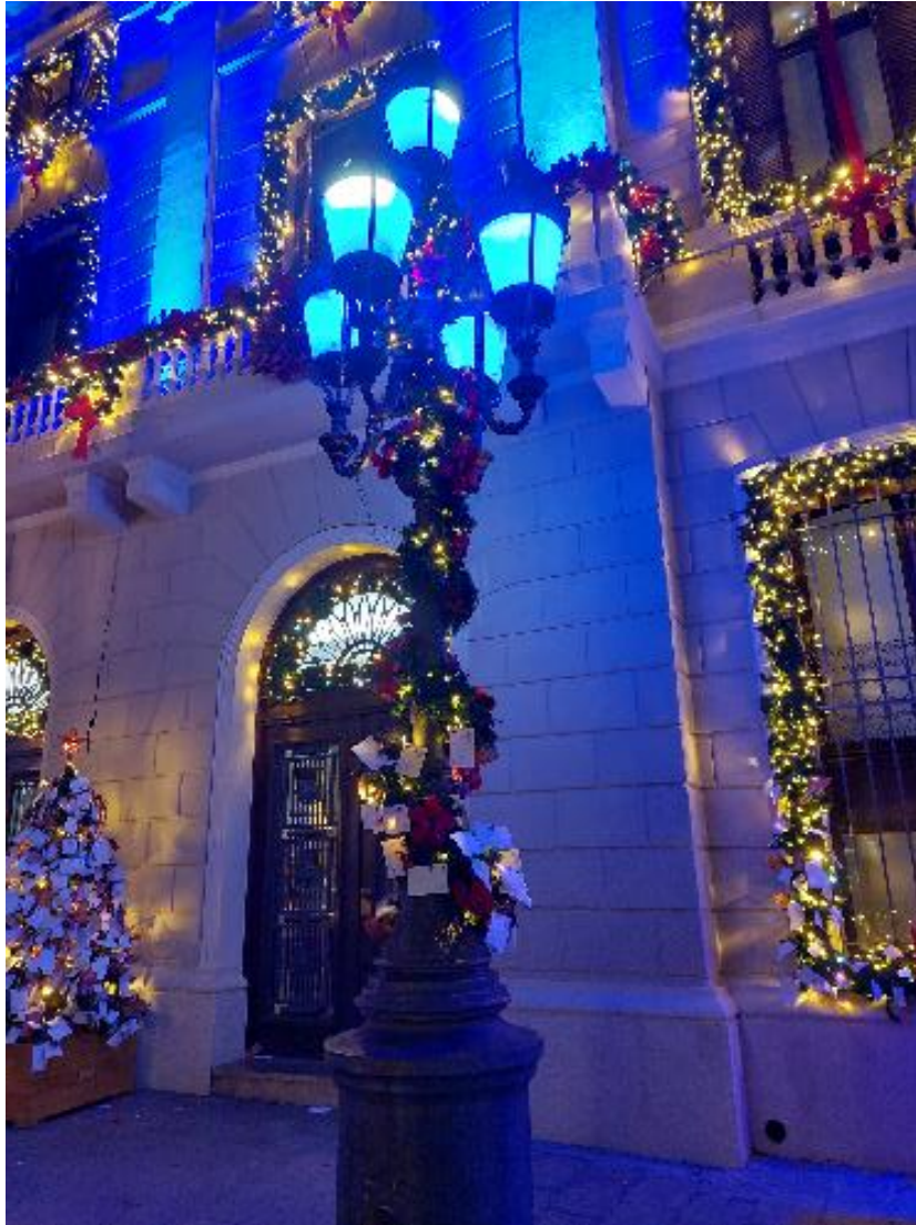
Exemple d'instal·lació lumínica i ornamentació dels 2 fanals modernistes