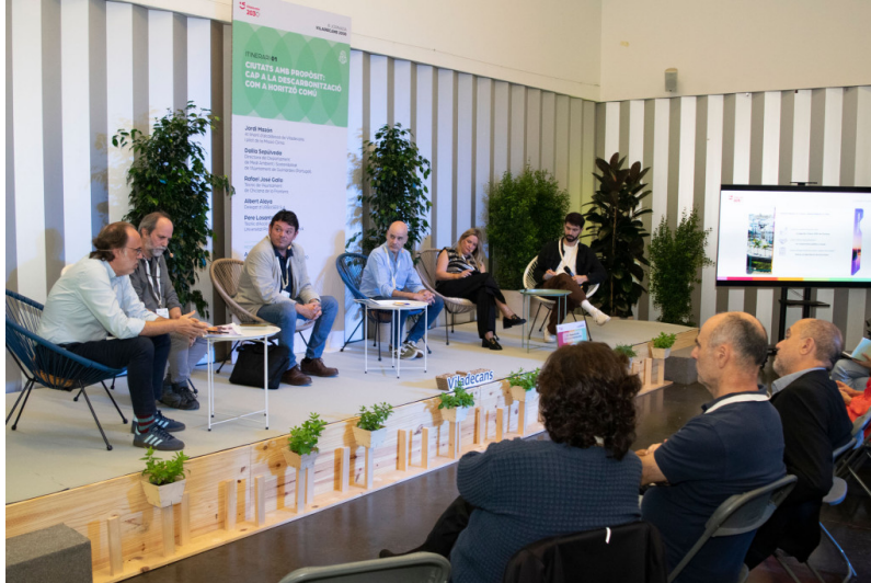
(escenari d'una de les sales)