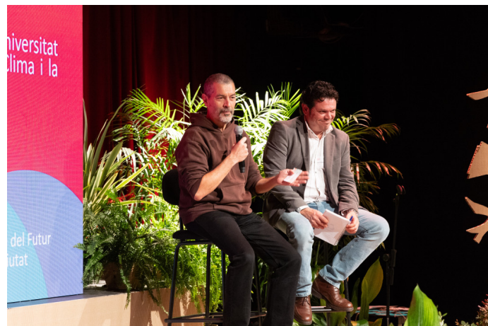
(Acte Signatura novembre 2024, exemple decoratiu)