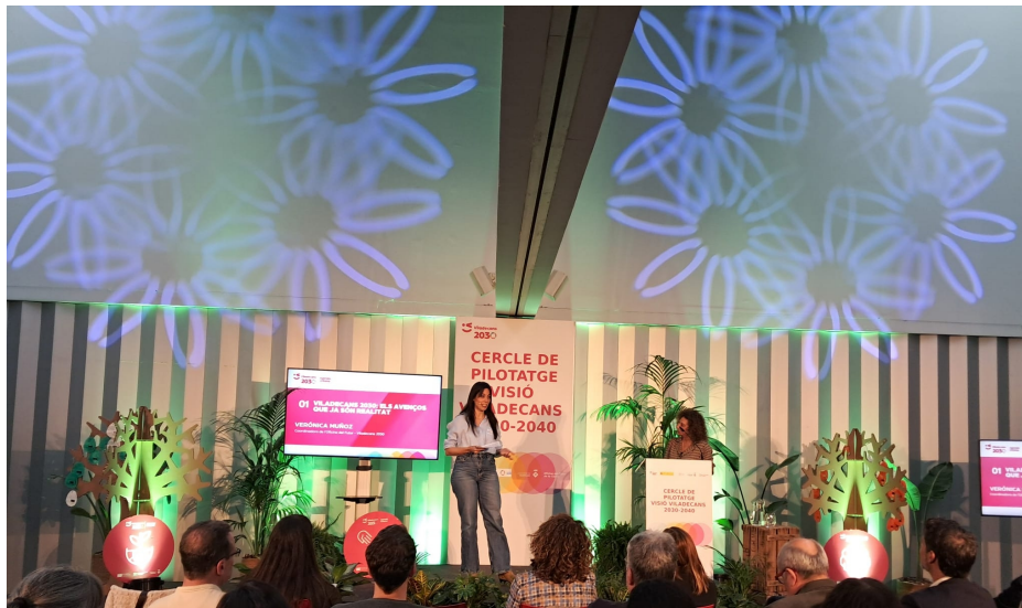
(il·luminació a les parets per crear ambient i decoració)