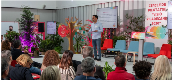
(Cercle de Pilotatge 2024, exemple decoratiu)