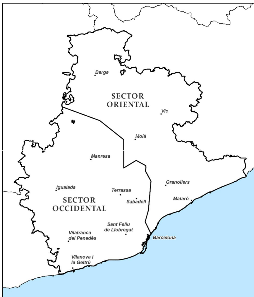
Figura 1 . Àmbits dels sectors d'actuació - Divisió

La província de Barcelona està dividida, a efectes de gestió de la conservació, en 2 sectors: sector oriental i sector occidental. (veure figura següent)