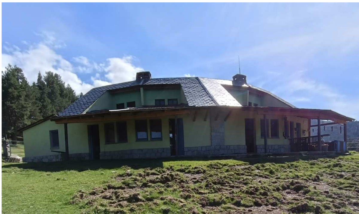
Il·lustració 2: Vista sud de l'edificació del refugi.