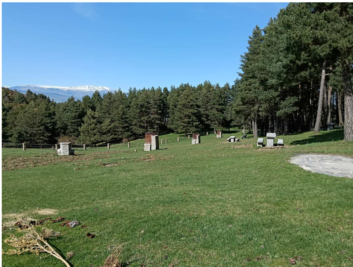
Il·lustració 1: Vista de l'espai exterior. Disposa de taules de pedra i quatre barbacoes protegides amb mata-guspies i allunyades de la massa forestal.