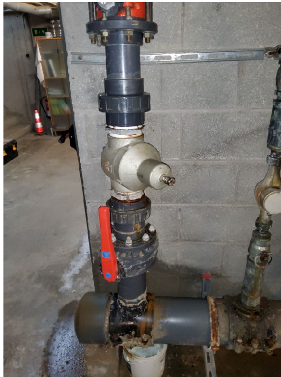
Foto 8. Vàlvula reguladora de pressió a substituir

També es preveu la substitució de la vàlvula reguladora de pressió situada en el ramal d'entrada d'aigua de xarxa al col·lector de distribució d'aigua potable situada en la sala d'instal·lacions de piscina de la planta soterrani.