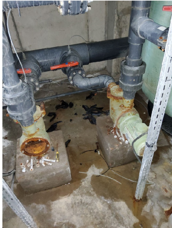
Foto 7. Bomba i prefiltrre piscina gran fora de servei

També es preveu la substitució de la vàlvula reguladora de pressió situada en el ramal d'entrada d'aigua de xarxa al col·lector de distribució d'aigua potable situada en la sala d'instal·lacions de piscina de la planta soterrani.