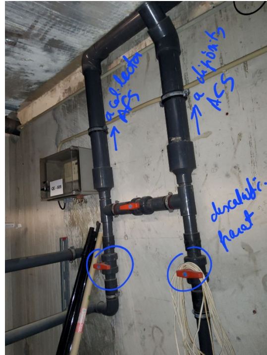
Foto 3. By-pass descalcificador fora de servei