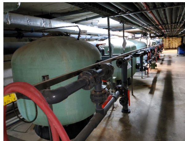
Foto 5. Filtres piscina gran (2 ut. en servei, 4 ut. Fora de servei)