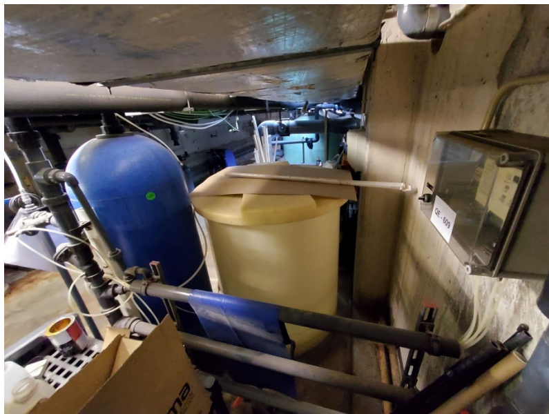
Foto 1. Descalcificador fora de servei

S'ha detectat que les aixetes del descalcificador estan tancades i la del by-pass oberta i l'emplenat dels circuits d'aigua de climatització, així com la de consum humà es realitza amb aigua directe de xarxa, la qual pot considerar-se dura per la zona en què es troba (Sant Feliu de Guíxols). Es recomana la reparació o substitució del descalcificador.