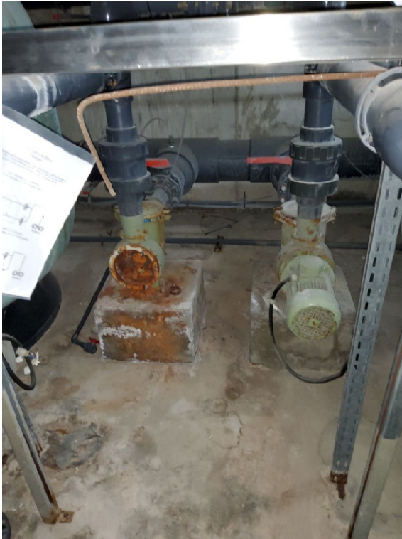
Foto 6. Bomba i prefiltrre piscina gran fora de servei