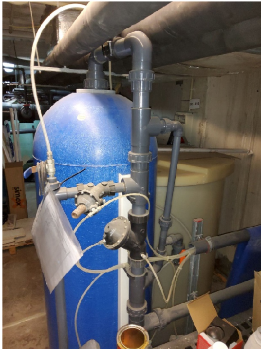
Foto 2. Descalcificador fora de servei