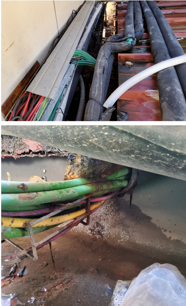
Fotos 9 i 10. Pas cablejat baixa tensió per canal de pluvials

S'ha observat un cablejat elèctric a coberta que travessa una canal de pluvials la qual s'ha perforat per permetre el seu pas, causant filtracions d'aigua cap a l'interior de l'edificació.