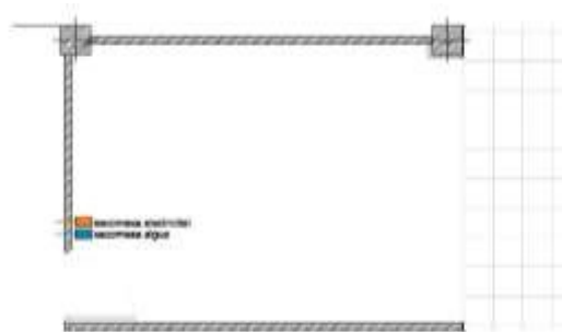
PLANS: SECCAT PEGAL DE LES PAREDES 100