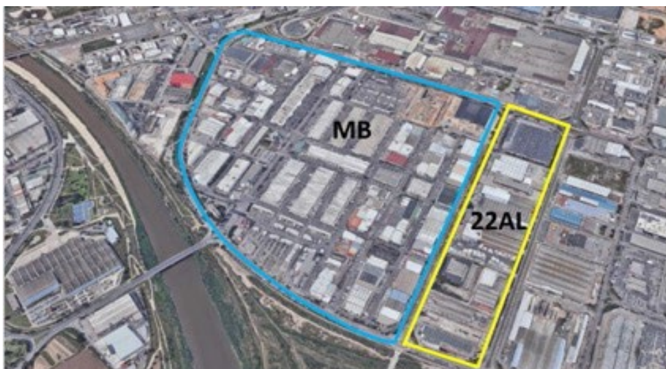
Vista de la situació actual del recinte de MERCABARNA.

La configuració actual del recinte es distribueix funcionalment entre dues àrees principals, la Unitat Alimentària (UA), que constitueix el nucli històric i operatiu de MERCABARNA i el sector 22a, incorporat al recinte a partir del gener de 2022, que ha suposat una ampliació significativa de l'àmbit funcional i operatiu.