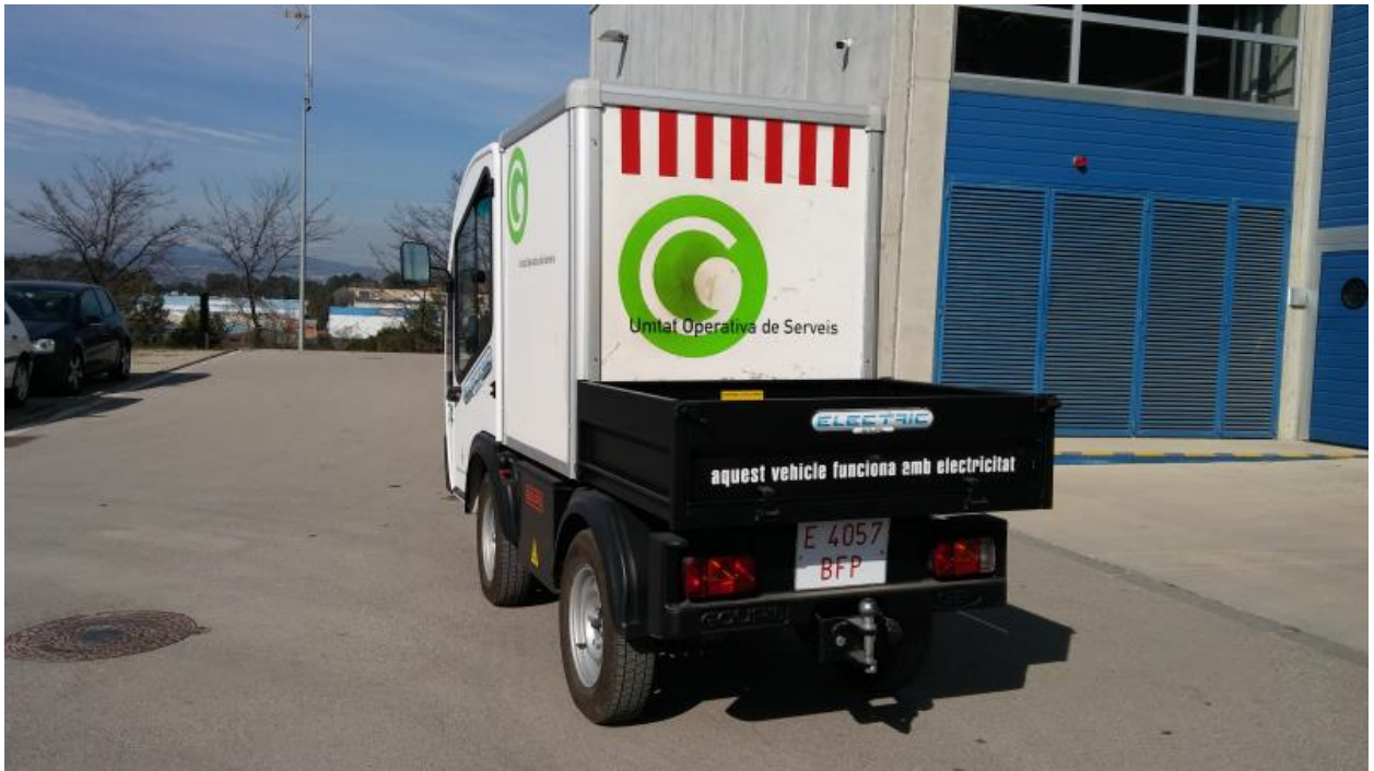
74 - GOUPIL AZR-2/G31 (VEHICLE ELÈCTRIC)