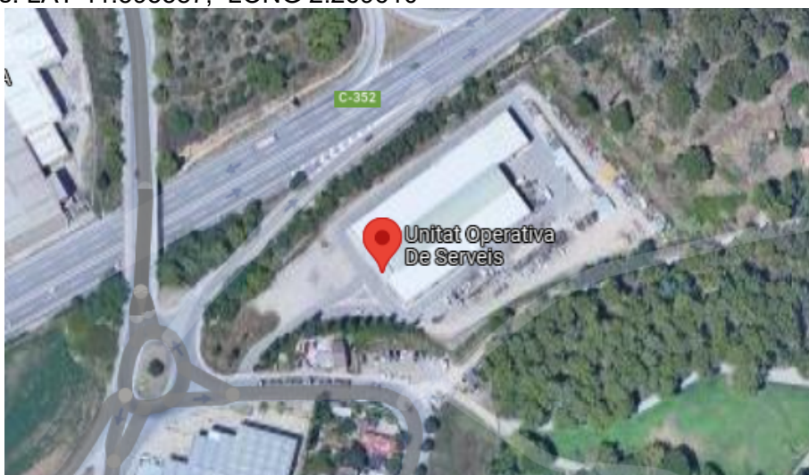
Ortofotomapa de la ubicació de la UOS.

Coordenades: LAT 41.595587, LONG 2.269610