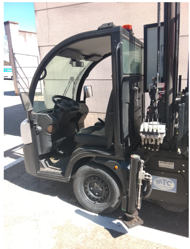
ELEVAFERETRES HIDRAULIC AMB MASTIL 6 MT GOUPILMAR G-4 ECO MTC 417