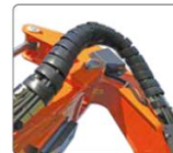
Antiribaltamento elettrico (SAB). Electric Roll-over protection system (SAB).