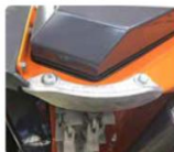
Slitto corpo tralicione. Flailhead skid.