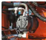
Impianto idraulico ad ingranaggi in circuito aperto. High Power Gear hydraulic system.