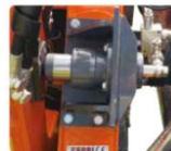
Reverse safety (patent pending). Reverse safety (patent pending).