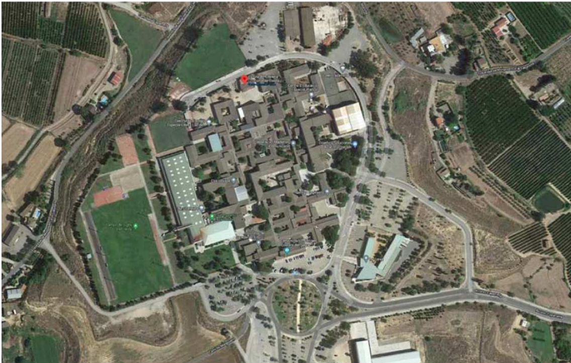
1: Ubicació de l'Escola Hoteleria i Turisme de Lleida

L'Escola d'Hoteleria i Turisme de Lleida, es troba ubicada dins del Complex de la Caparrella, aquesta escola ofereix un cicle formatiu grau mitjà de cuina i gastronomia en modalitat presencial, aquests estudis capaciten per tècniques elementals de cuina i de cocció, disseny de menús i cartes, tastos sensorials i organolèptics de productes. Projectes innovadors i esdeveniments per a diferents elaboracions. La competència general d'aquest títol consisteix a executar les activitats de preelaboració, presentació, conservació, finalització, presentació i servei de tot tipus d'elaboracions culinàries en l'àmbit de la producció en cuina, seguint els protocols de qualitat establerts i actuant segons normes d'higiene, prevenció de riscos laborals i protecció ambiental.