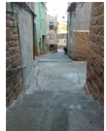
Carrer de la NOGUERA