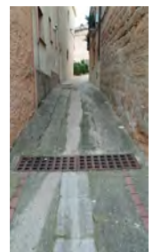
Carrer del CALVARI