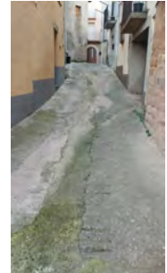
Carrer de DALT

Arquitecte redactor: Miquel Ortiz i Terré