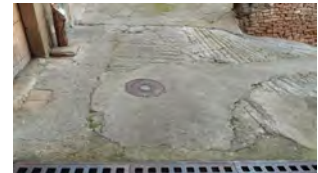
Plaça de les ESCOLES