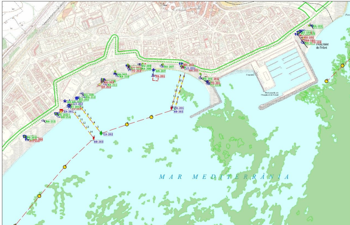
PLA DE DISTRIBUCIÓ D'USOS I SERVEIS DE TEMPORADA DE LES PLATGES 2022-2026 Temporada 2026