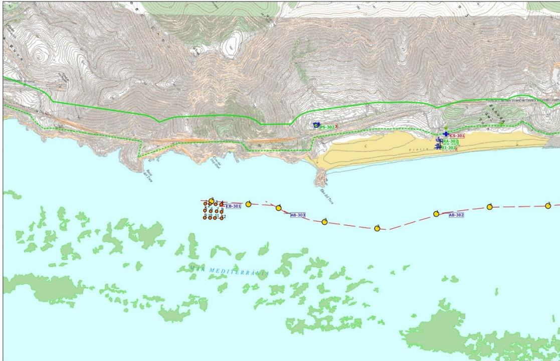
PLA DE DISTRIBUCIÓ D'USOS I SERVEIS DE TEMPORADA DE LES PLATGES 2022-2026 Temporada 2026