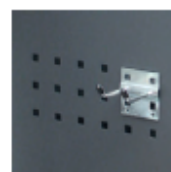
Detalle del lateral troquelado. (Ganchos no incluidos)