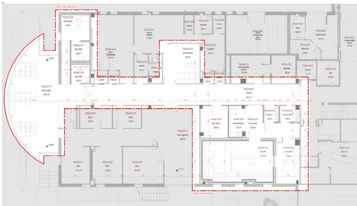
Àrea a reformar a Planta Semi-Sotterrani. Servei de Radiologia i antigues Urgències (en desús)