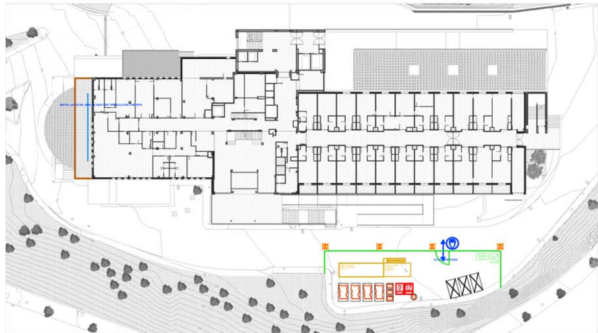
PLANTA BAIXA. ESTAT ACTUAL. 1 : 500