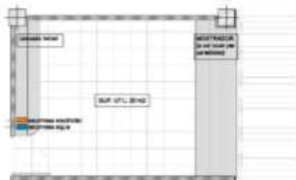
PLANTA. POSSIBLE DISTRIBUCIÓ DE LES PAREDES

SANT PERE DE RIBES PROPOSTA PAREDES MERCAT