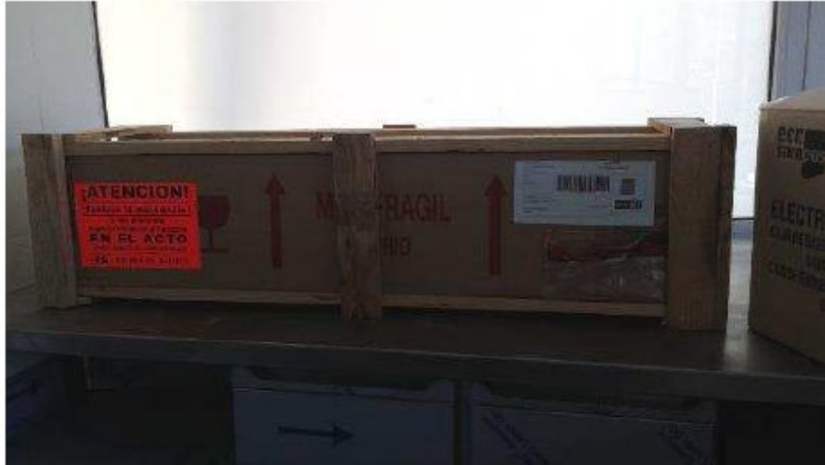
Número 25.-SOBRE LATERAL FREGADERA