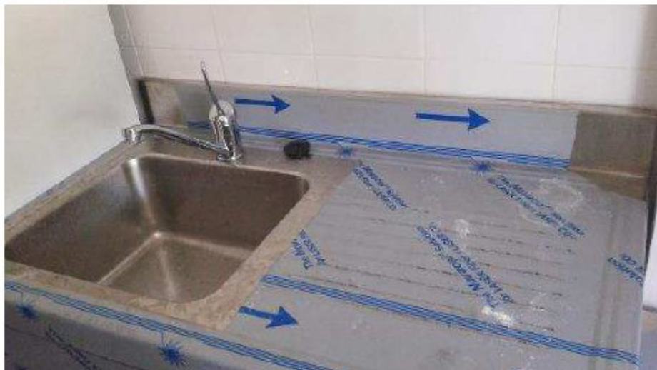
Número 27.-GRIFO MONOMANDO GERONTOLÓGICO