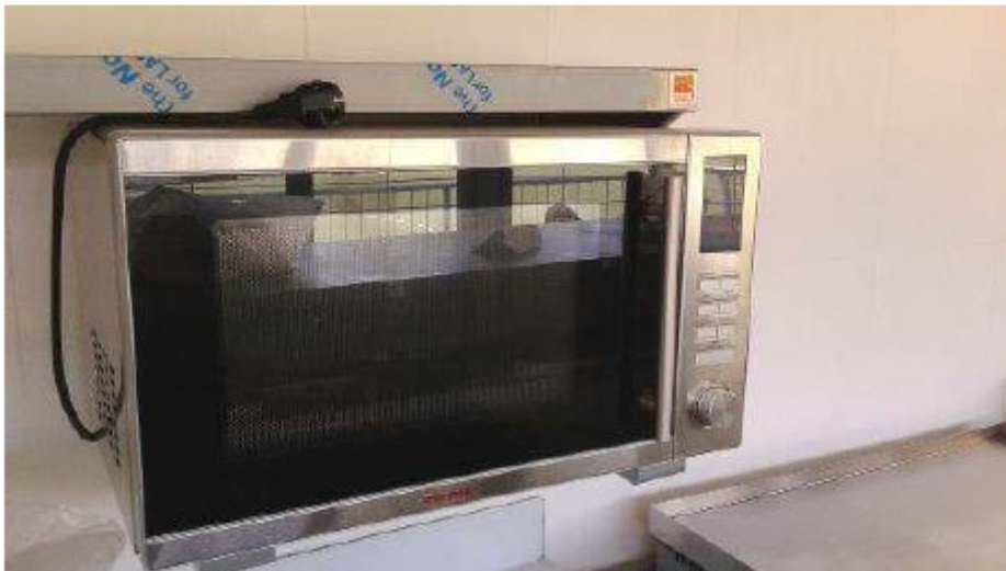
Número 21.- MICROONDAS