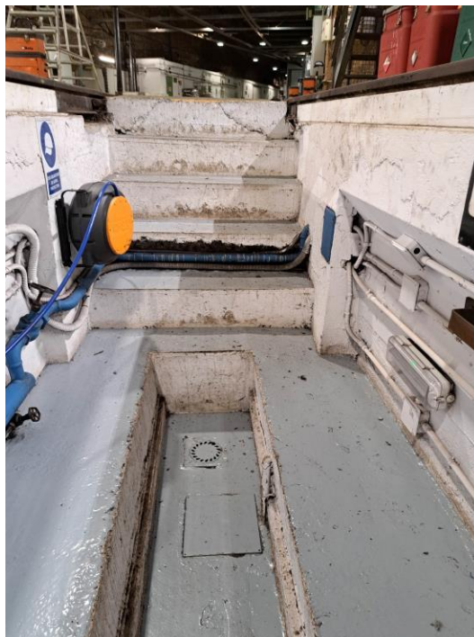
Vista general del fossat de via 7