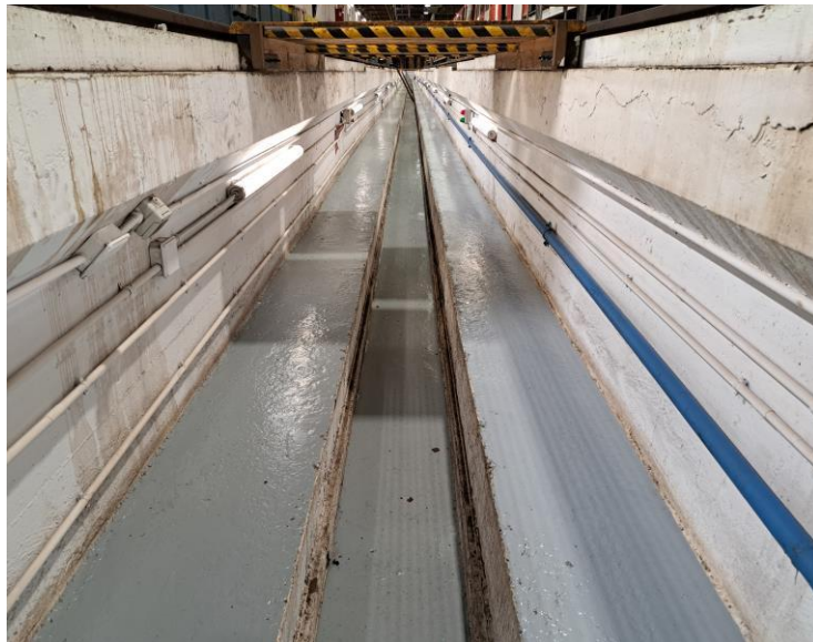
Vista general del fossat de via 7