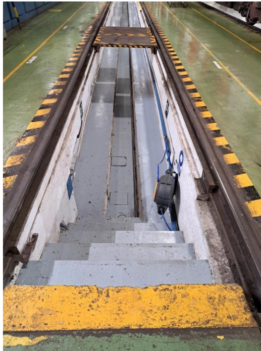
Vista general del fossat de via 7