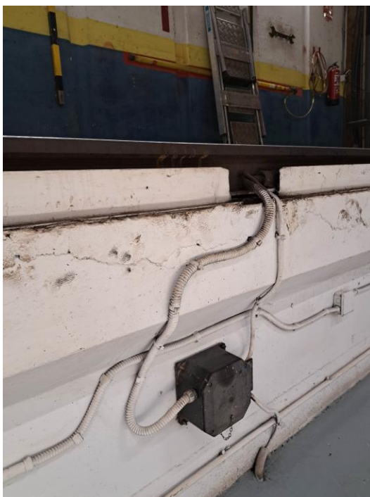
Instal·lació de circuits de via (senyalització ferroviària)