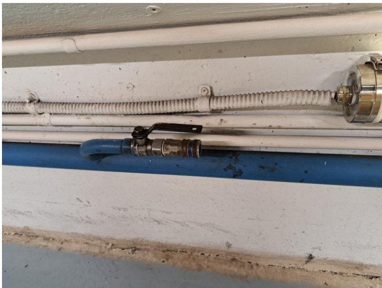
Instal·lació d'aire comprimit