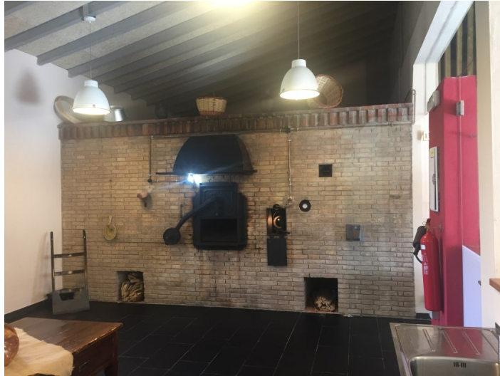
Espai Bar-cafeteria/visuals amb el forn