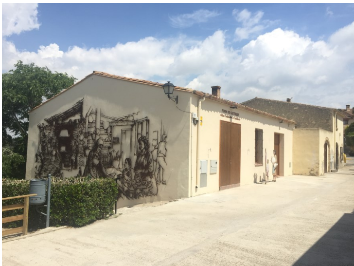
Magatzem exterior darrera