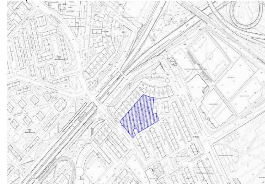
Imatge de l'àmbit d'actuació

En data 15 d'abril de 2024, la Secció d'Instal·lacions i Serveis Urbans de l'AMB sol·licita informació referent a totes les instal·lacions i serveis existents del Parc Fluvial del Besòs, afectades pel "Projecte Plaça 25 d'Octubre al T.M. de Sant Adrià de Besòs" en el que estan treballant.