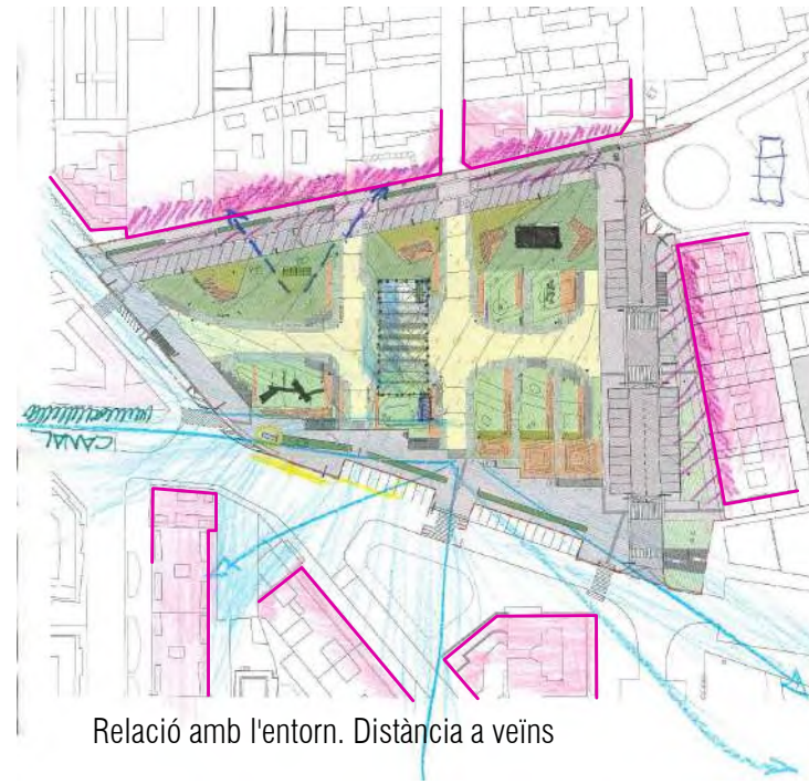
Relació amb l'entorn. Distància a veïns