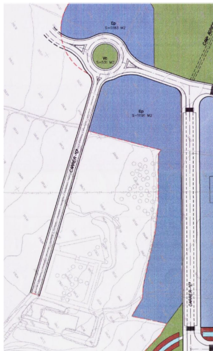
Plànols d'ordenació: 6.1 Zonificació

Quan es tracta d'edificis independents corresponents a diferents tipus d'equipament, en una mateixa illa en el cas d'equipament polivalent (Ep), els paràmetres s'han d'entendre en relació amb la superfície de parcel·la corresponent a cada edifici.