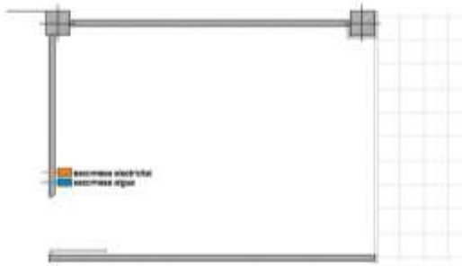
PLANTA: ESTAT INICIAL DE LES PARADES