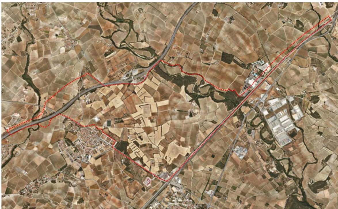
Plano del ámbito de estudio del PDU.

Así mismo, la zona de estudio de este PDU presenta una relación con la Pista de Pruebas y Laboratorio Oficial del Automóvil de Cataluña con un tamaño aproximado de 335 ha.