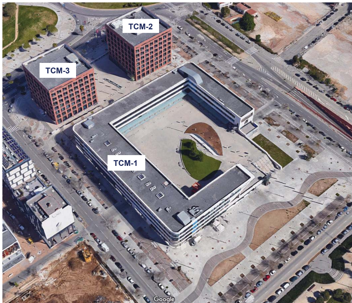
Foto aèria de les zones incloses en aquest contracte.

Resum d'amidaments de les zones objecte del contracte.