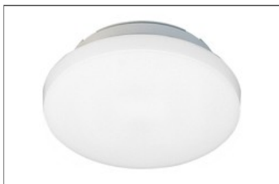
Sol + KST