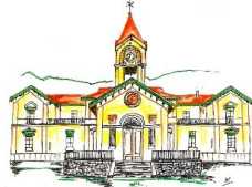
AJUNTAMENT DE DAS