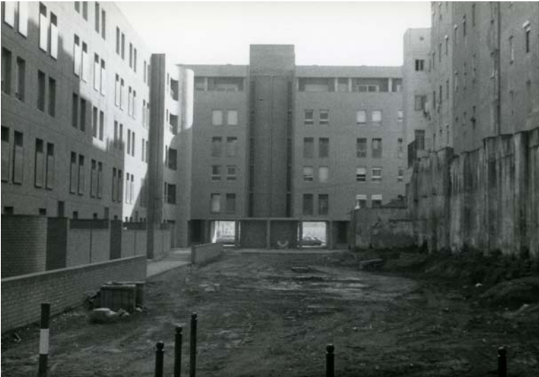
Plaça Antoni Genescà i Coromines l'any 1989 abans de ser urbanitzada.

Durant el 2010, en el marc del desplegament de la Llei de Barris de la Barceloneta, es van dur a terme millores a les tres places públiques del conjunt d'habitatges, plaça de la Maquinista, de Pompeu Gener i d'Antoni Genescà per tal d'afavorir sobretot el seu ús veïnal com a llocs d'estada i no només de pas. El projecte de l'estudi Espinàs i Tarrassó Associats va proposar millores a les dues places dels extrems, a la d'Antoni Genescà i Coromines amb l'objectiu de potenciar la relació visual i física d'ambdós espais amb el carrer de Cermeño perquè tinguessin més presència i