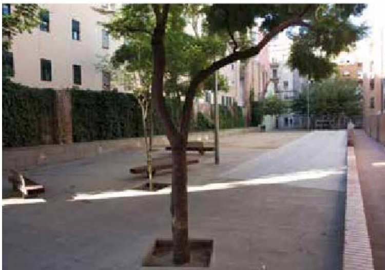
Plaça d'Antoni de Genescà i Coromines l'any 2011

Durant el 2010, en el marc del desplegament de la Llei de Barris de la Barceloneta, es van dur a terme millores a les tres places públiques del conjunt d'habitatges, plaça de la Maquinista, de Pompeu Gener i d'Antoni Genescà per tal d'afavorir sobretot el seu ús veïnal com a llocs d'estada i no només de pas. El projecte de l'estudi Espinàs i Tarrassó Associats va proposar millores a les dues places dels extrems, a la d'Antoni Genescà i Coromines amb l'objectiu de potenciar la relació visual i física d'ambdós espais amb el carrer de Cermeño perquè tinguessin més presència i