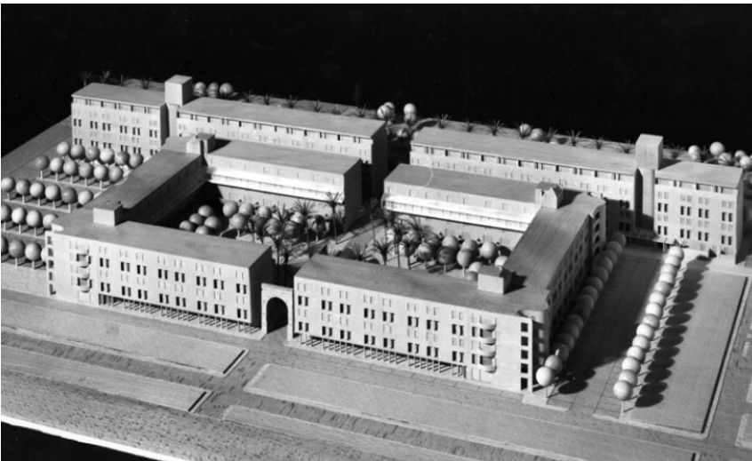
Maqueta del projecte original d'habitatges socials al solar de la Maquinista (1979-1988).

L'espai àmbit d'actuació és resultat de l'ordenació realitzada amb el projecte de l'estudi MBM Arquitectes l'any 1979-1988 per a la realització de 200 habitatges socials als antics terrenys del complex industrial de La Maquinista. El conjunt d'habitatges es va organitzar en una barra lineal amb façana al Passeig de Salvat Papasseit i un conjunt tancat en si mateix sobre un pati rectangular obert per a vianants (actual plaça Pompeu Gener) entre carrers de Ginebra, de Cermeño-Salamanca i d'Andrea Dòria. A l'altre banda dels costats curts de l'agrupació en rectangle se situaren dues bosses d'aparcament en superfície. La del costat sud, que separava el conjunt d'habitatges amb una altra agrupació existent d'habitatges amb façana al carrer d'Andrea Dòria, va ser consolidada amb els anys com a l'actual espai públic d'Antoni Genescà i Coromines. A l'altre banda del conjunt d'habitatges, si bé es projectà només com a una bossa d'aparcament, amb els anys es consolidà, igual que a l'altre costat, amb una nova edificació alineada al carrer de Ginebra i un espai entremig consolidat com a l'actual plaça de la Maquinista.