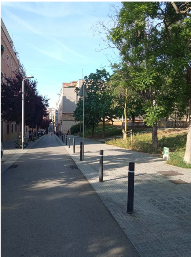
10. Tram carrer de la Florida amb la Plaça Nou Barris.