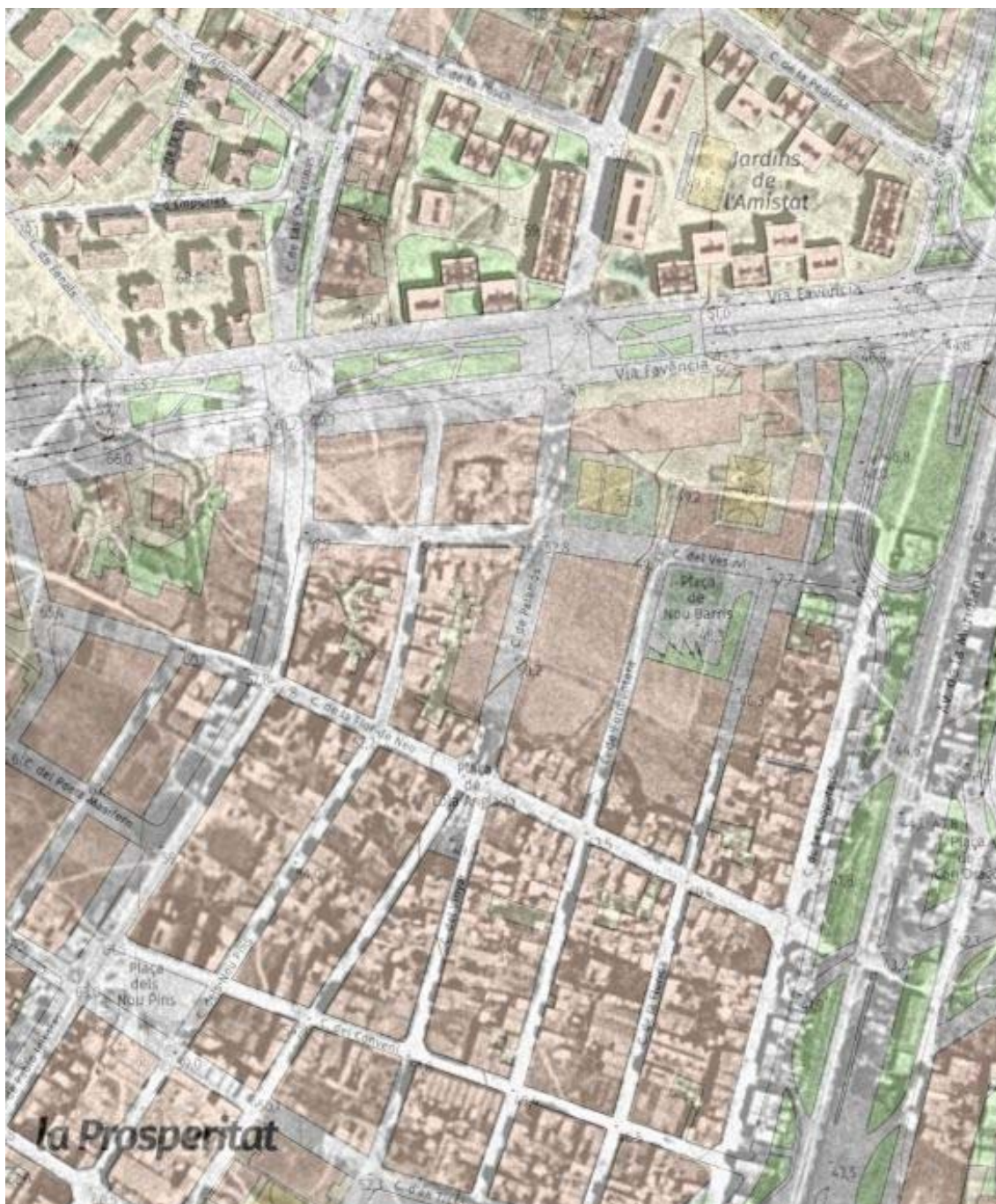
Fig. Superposició d'una ortofoto del 1.945 del barri de la Prosperitat i plànol topogràfic actual.

En aquest cas, destacariem l'Escola Mercè Rodoreda, ubicada al número 35 del carrer del Vesuvi. Inaugurada al setembre de 1.984, l'escola va sorgir de la fusió de dues escoles prèvies, el CP Vesuvi i el CP Cooperació i va marcar una fita en l'educació del barri, sent pionera en la implementació del projecte d'immersió lingüística a Nou Barris i una de les primeres a Barcelona. Conjuntament amb la Plaça de Nou Barris, ubicada al seu davant, nascuda fruit també d'una forta reivindicació veïnal, que pren el nom del districte 8è i es troba situada en la confluència dels carrers de Formentera, del Vesuvi i de la Florida.