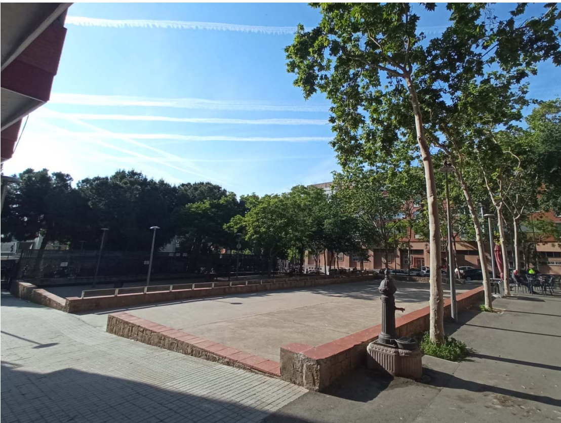
12. Vista de la Plaça sense nom situada a l'encreuament entre els carrers de Palamós i del Vesuvi.