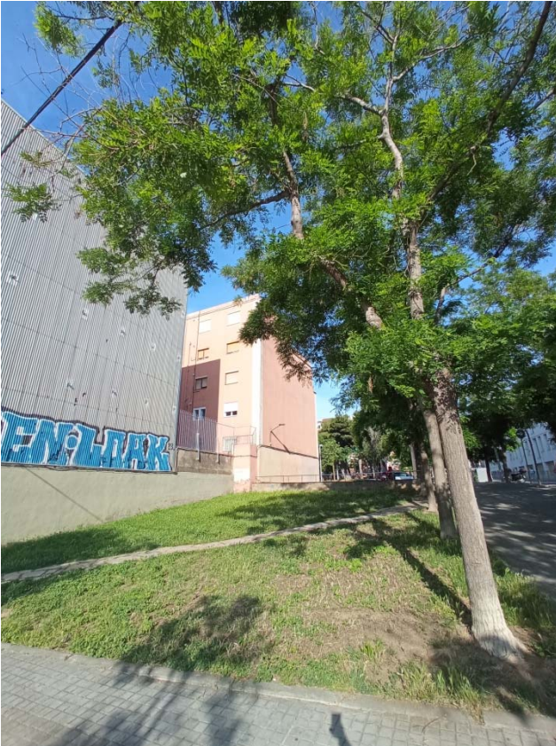
04. Detall parterre i mitgeres del carrer Vesuvi amb el lateral d'Av. Meridiana