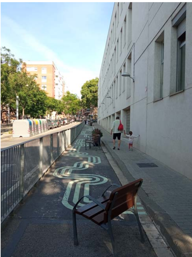
02. Detall actuacions del Programa municipal "Protegim les Escoles" al carrer del Vesuvi