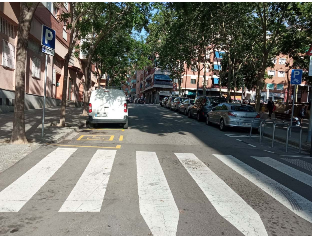
05. Tram carrer del Vesuvi des del carrer Formentera fins al carrer Palamós.