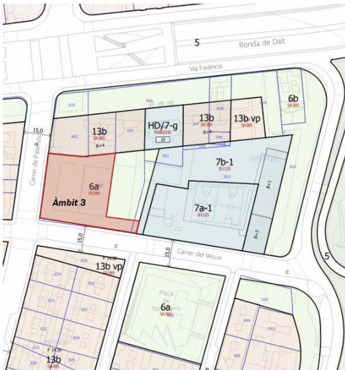
A2. Fase 2. Àmbit 3: objecte de la licitació.

L'àmbit d'actuació de la licitació englobaria les dues plataformes superiors de la Plaça i el passeig arbrat que connecta amb l'accés a l'Escola.