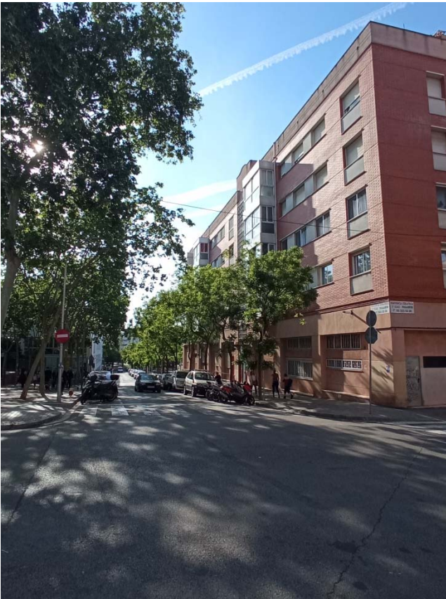
06. Cantonada carrer del Vesuvi amb el carrer de Palamós.