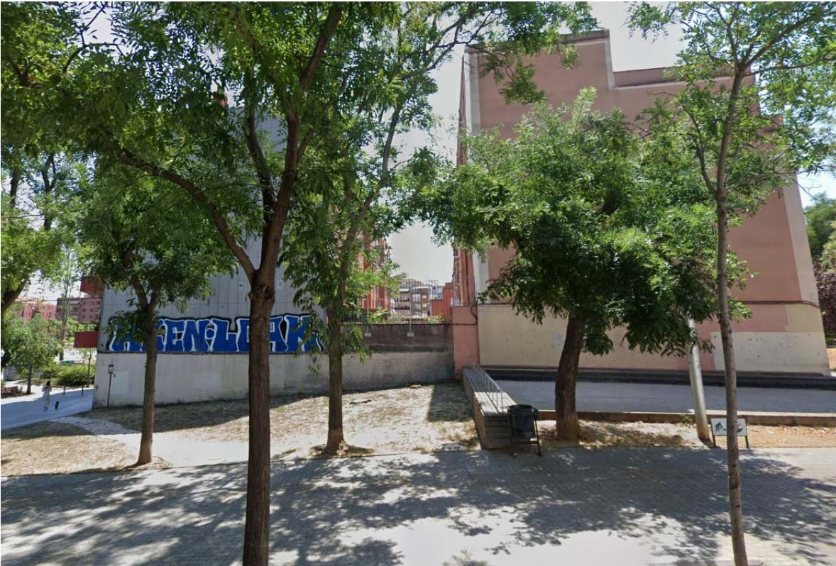
03. Estat actual mitgeres del carrer del Vesuvi amb l'àrea de jocs de petanca.