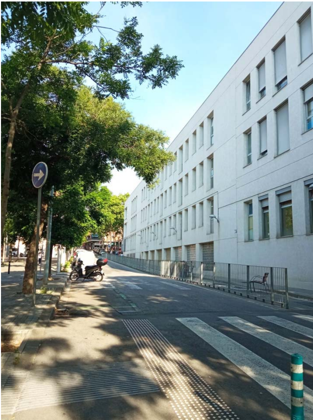
01. Tram carrer del Vesuvi entre el carrer de la Florida i l'Escola Mercè Rodoreda.