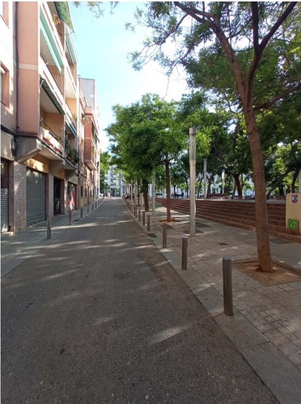
11. Tram carrer Formentera amb la Plaça Nou Barris.