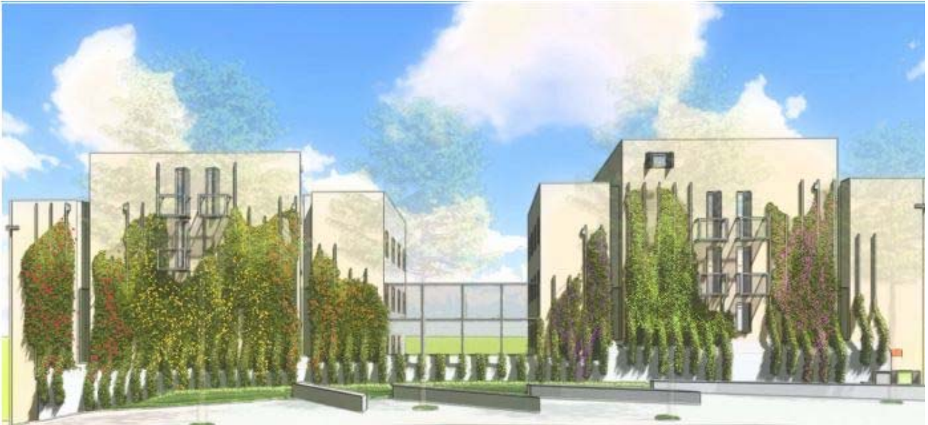
Fig. Imatge del Projecte d'intervenció de mitgeres de la Plaça Nou Barris.