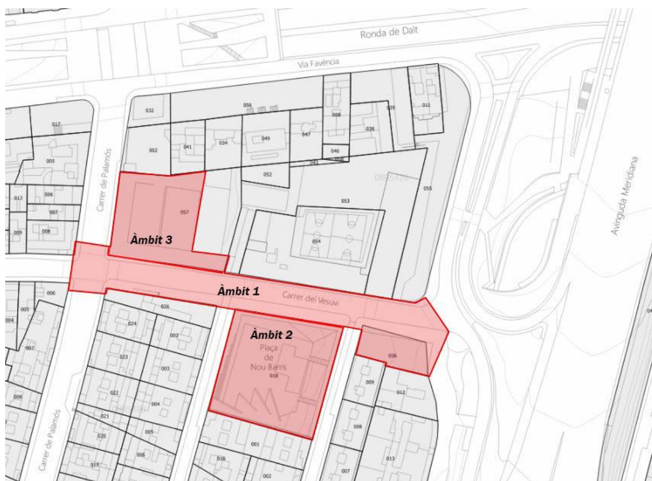
A0. Àmbits 1, 2 i 3, del tram del carrer del Vesuvi i entorn objecte de la licitació