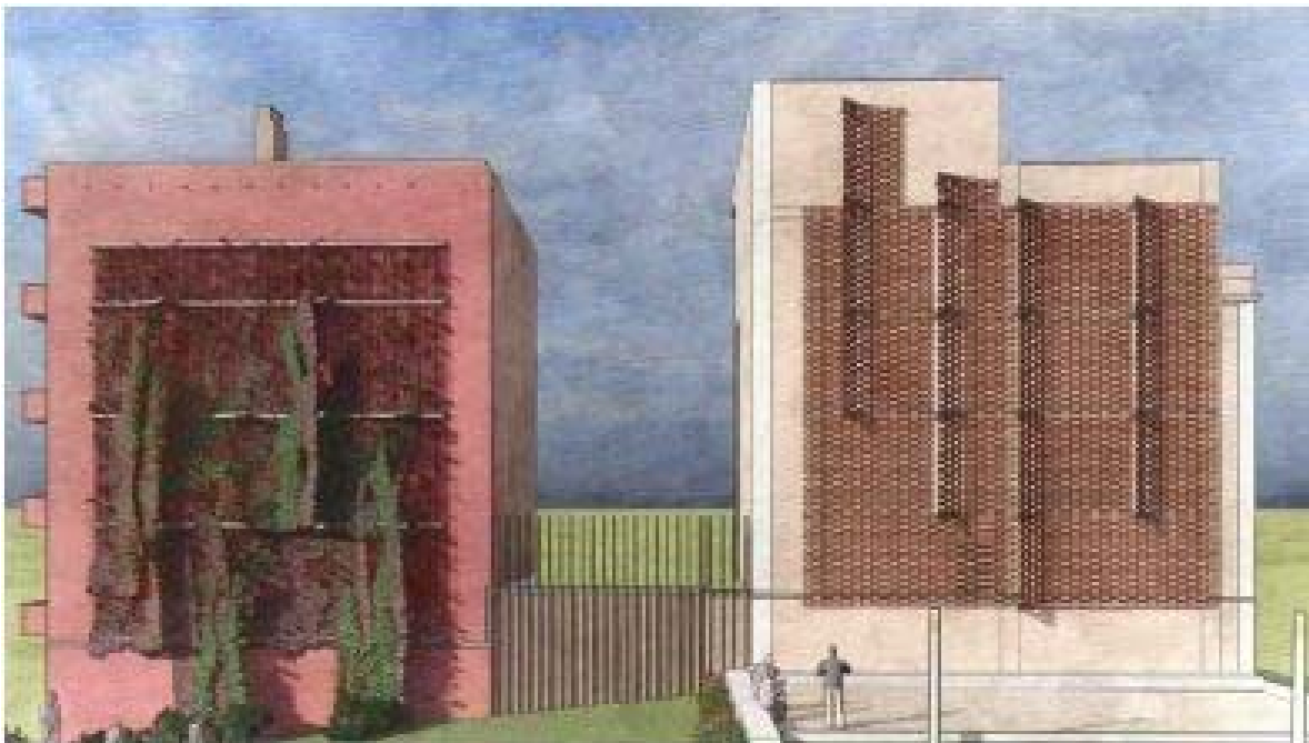
Fig. Imatge del Projecte d'intervenció de mitgeres del carrer Vesuvi.