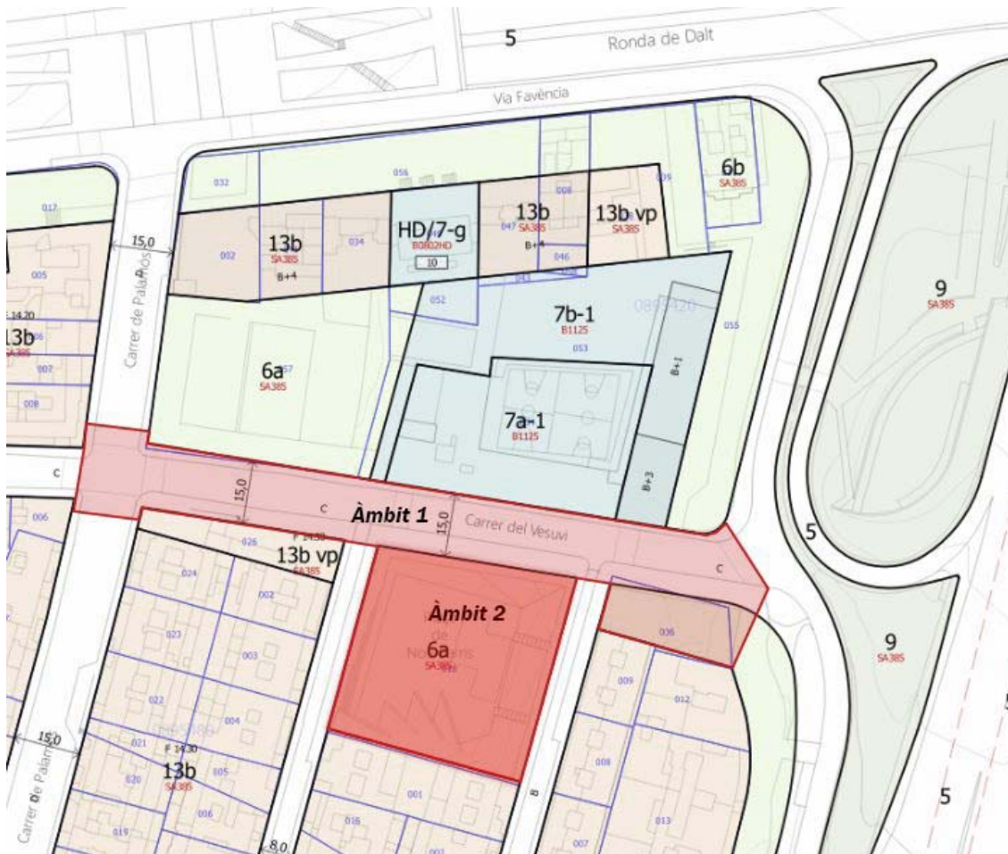
A1. Fase 1. Àmbits 1 i 2: objecte de la licitació.

enfiladisses, que cobriran parcialment les mitgeres integrant-les en l'entorn vegetat de la plaça. S'incorporaran nous habitats per a fauna protegida, així com hotels d'insectes.