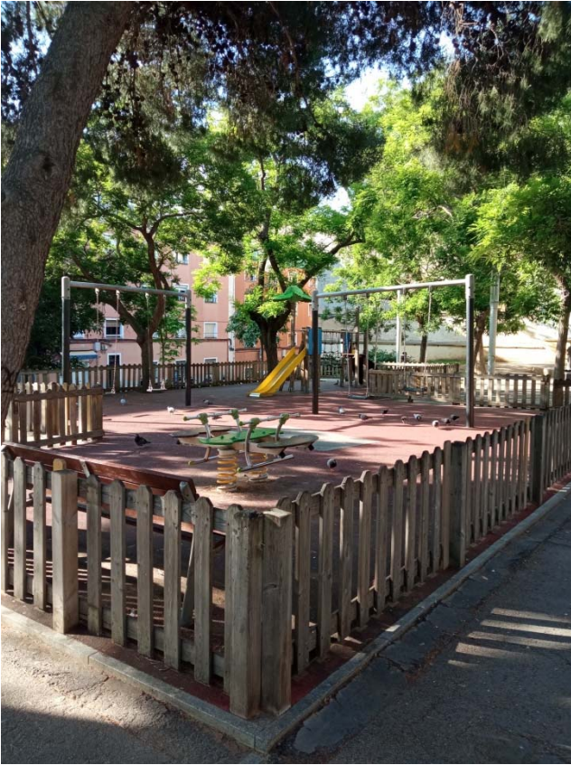
08. Vista de la zona de Jocs infantils de la Plaça Nou Barris.