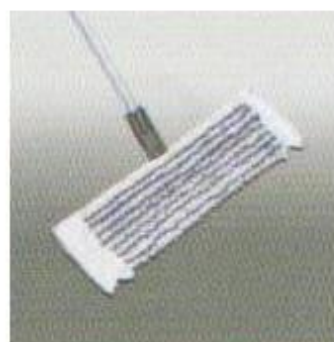
Eixugat del terra