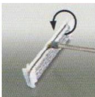
Voltegem la Mopa