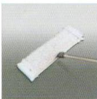
Fregat del terra en humit

Per altra banda, aconseguim millorar els resultats de neteja en els terres amb la utilització d'una mopa que realitza una doble funció; per una banda, neteja amb un poder d'arrossegament màxim i per l'altre eixuga i retira el sobrant d'aigua.