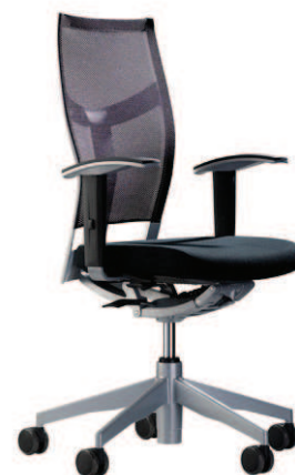
Operativa R. Malla

Mecanismo de sincronización del movimiento asiento-respaldo con 4 puntos de giro. Es un mecanismo abierto compuesto por un chasis de aluminio y en su interior un pistón y un muelle/tensor que permite personalizar auto-ajustando la presión del mecanismo. Por la posición de los ejes de giro y la presión que el usuario ejerce sobre el respaldo hace que levatemos nuestro propio peso y ejerzamos de forma automática el control sobre la tensión.