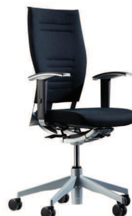
Operativa R. Tapizado