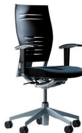
Operativa R. Inyección