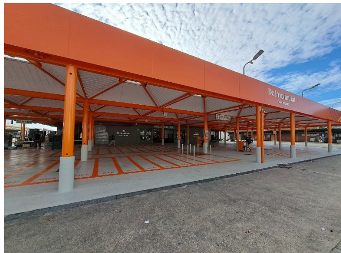
Estat actual Situat Productors

Tot i tractar-se de diferents tipus d'empreses, l'activitat a tots dos espais és similar: bàsicament comercial, amb l'exposició i venda dels seus propis productes, per tant, es tracta de venda de productes de proximitat. Aquesta activitat principal comporta d'altres auxiliars com la càrrega i descàrrega de les mercaderies, per això són també importants