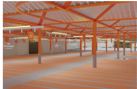
Estudi Previ Situat Productors