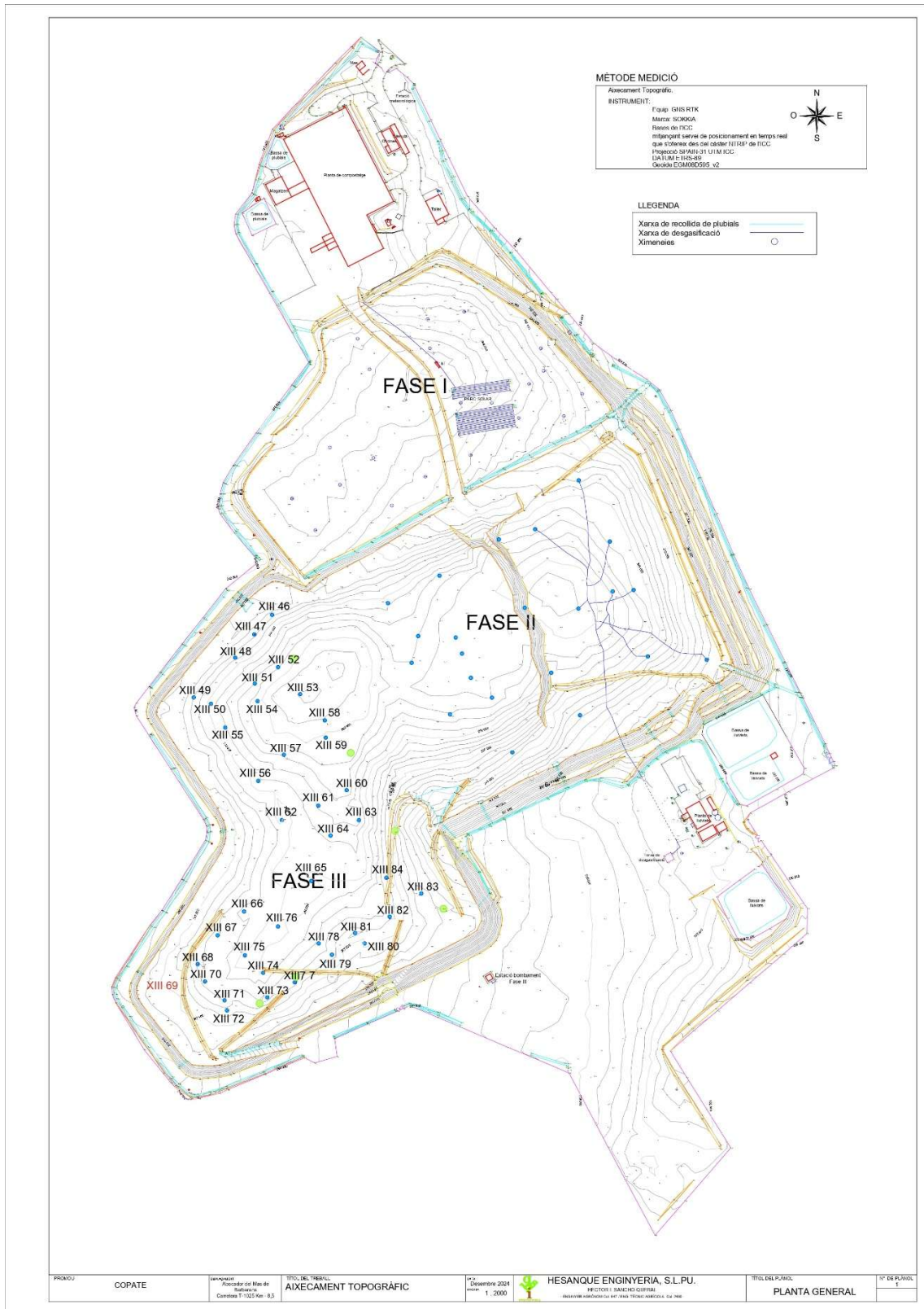
Fig. 3.- Plànol de la xarxa de desgasificació de la fase III del Dipòsit Controlat de Residus de Mas de Barberans (xemeneies actuals).