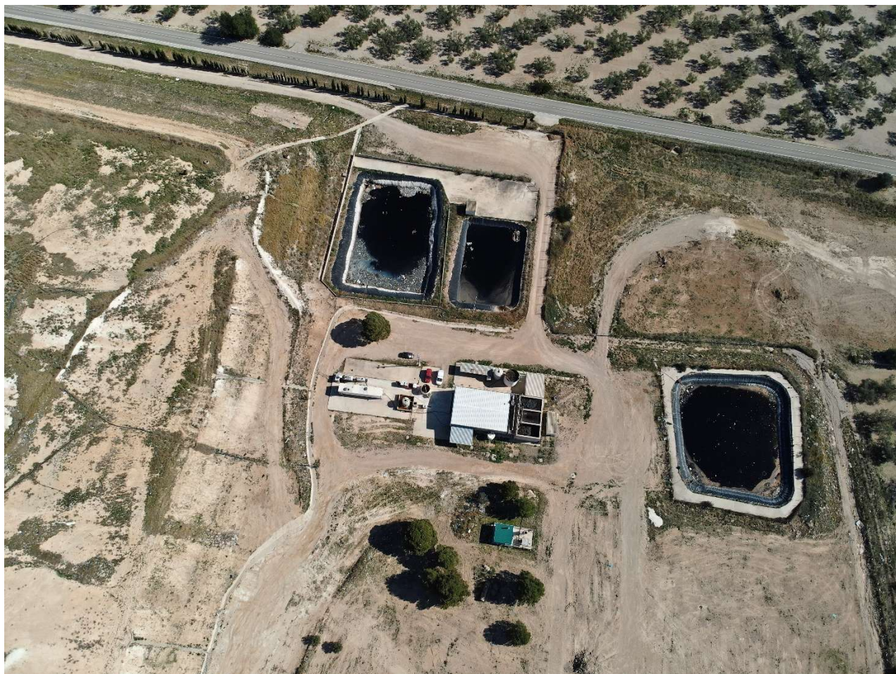
Fig. 6.- Planta de lixiviats de Mas de Barberans.

CONSORCI DE POLÍTIQUES AMBIENTALS DE LES TERRES DE L'EBRE