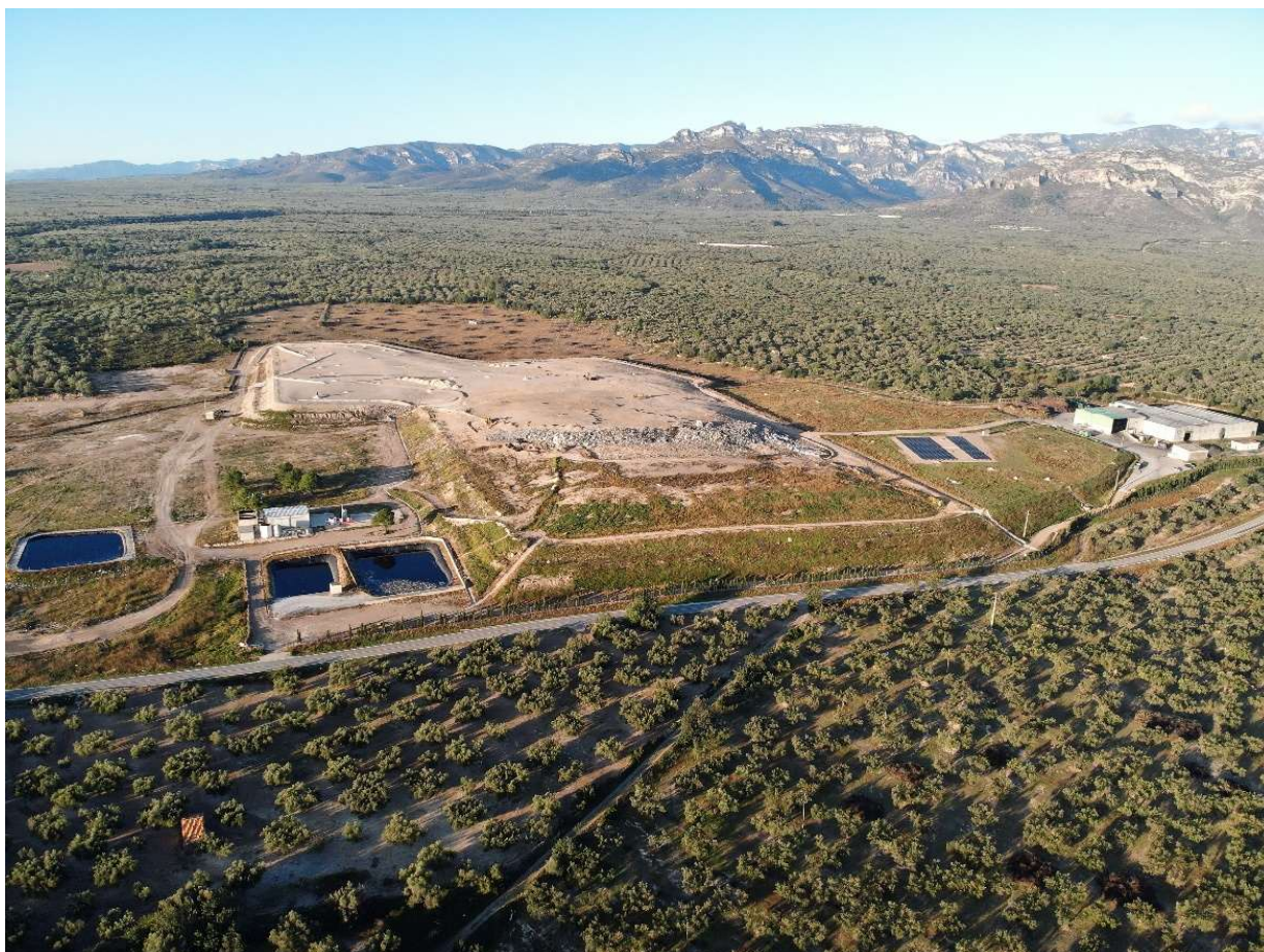
Fig. 4.- Dipòsit Controlat de Residus de Mas de Barberans, amb les diferents fases i basses de lixiviats.

CONSORCI DE POLÍTIQUES AMBIENTALS DE LES TERRES DE L'EBRE