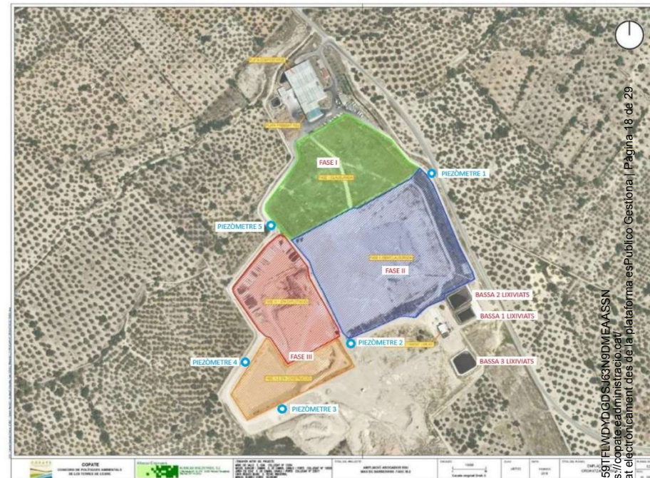
Fig. 1.- Plànol d'ubicació del Dipòsit Controlat de Residus de Mas de Barberans (basses de lixiviat, piezòmetres i fases).