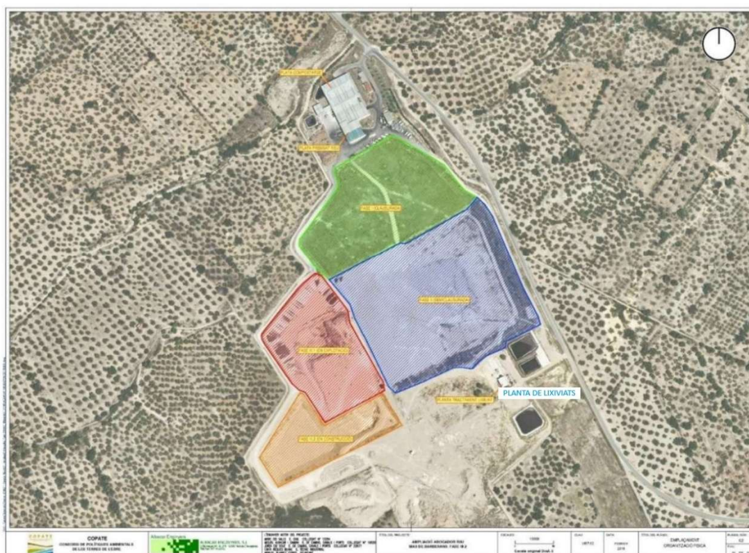
Fig. 5.- Plànol d'ubicació de la planta de lixiviat de Mas de Barberans.