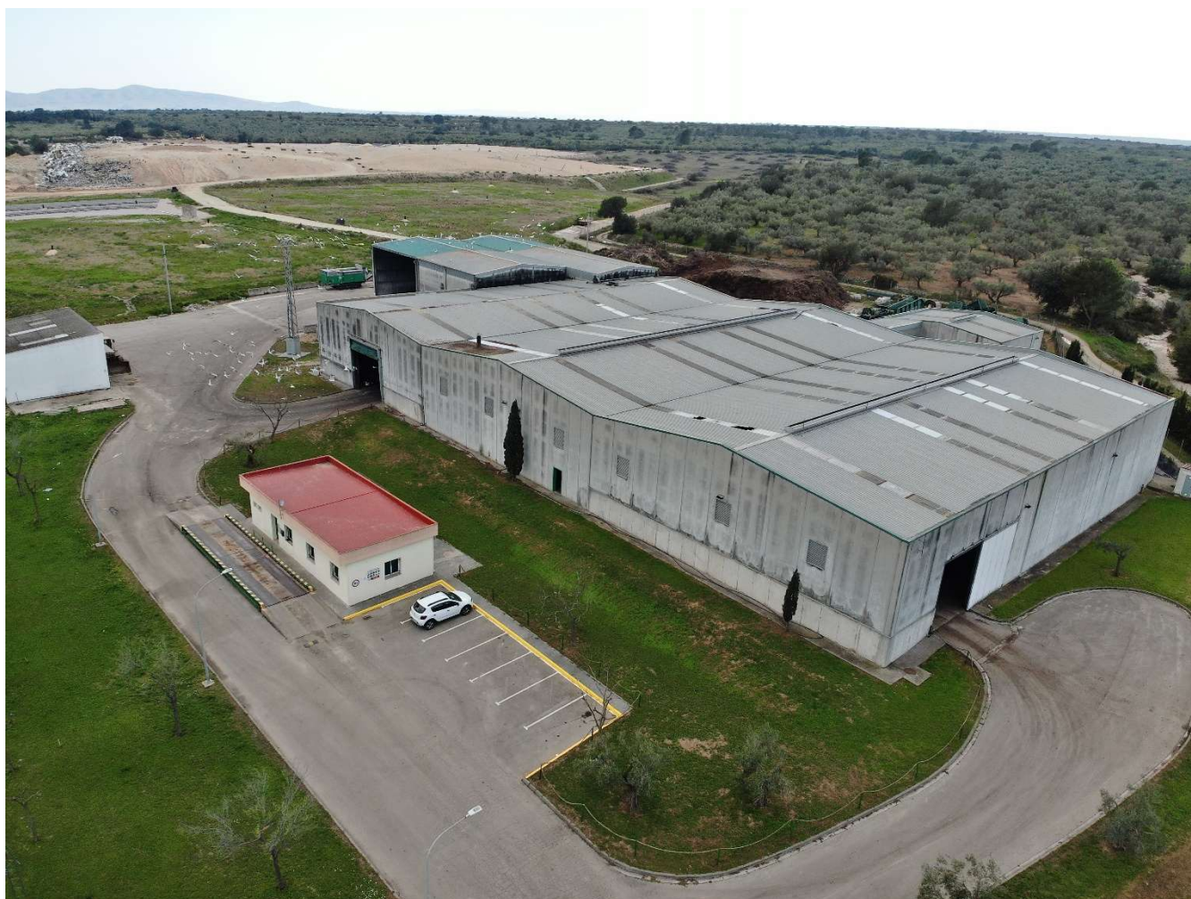
Fig. 8.- Planta de compostatge de Mas de Barberans.

CONSORCI DE POLÍTIQUES AMBIENTALS DE LES TERRES DE L'EBRE