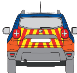
REFLECTANT VERMELL I GROC PART POSTERIOR