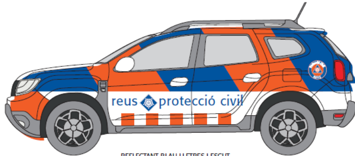
REFLECTANT BLAU LLETRES I ESCUT REFLECTANT TARONJA QUADRES LATERALS