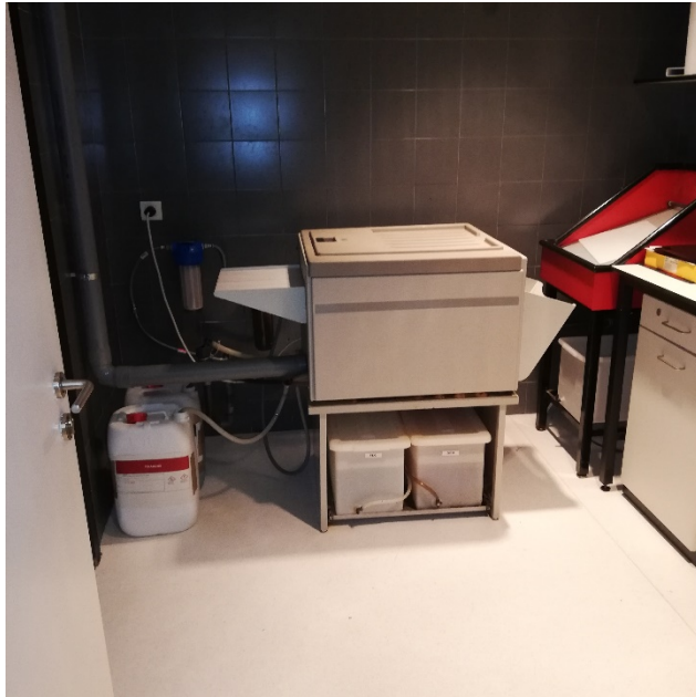
Imatge 3: Processadora per revelar la pel·lícula

processadora automàtica per, posteriorment, visionar les radiografies en un negatoscopi mural.