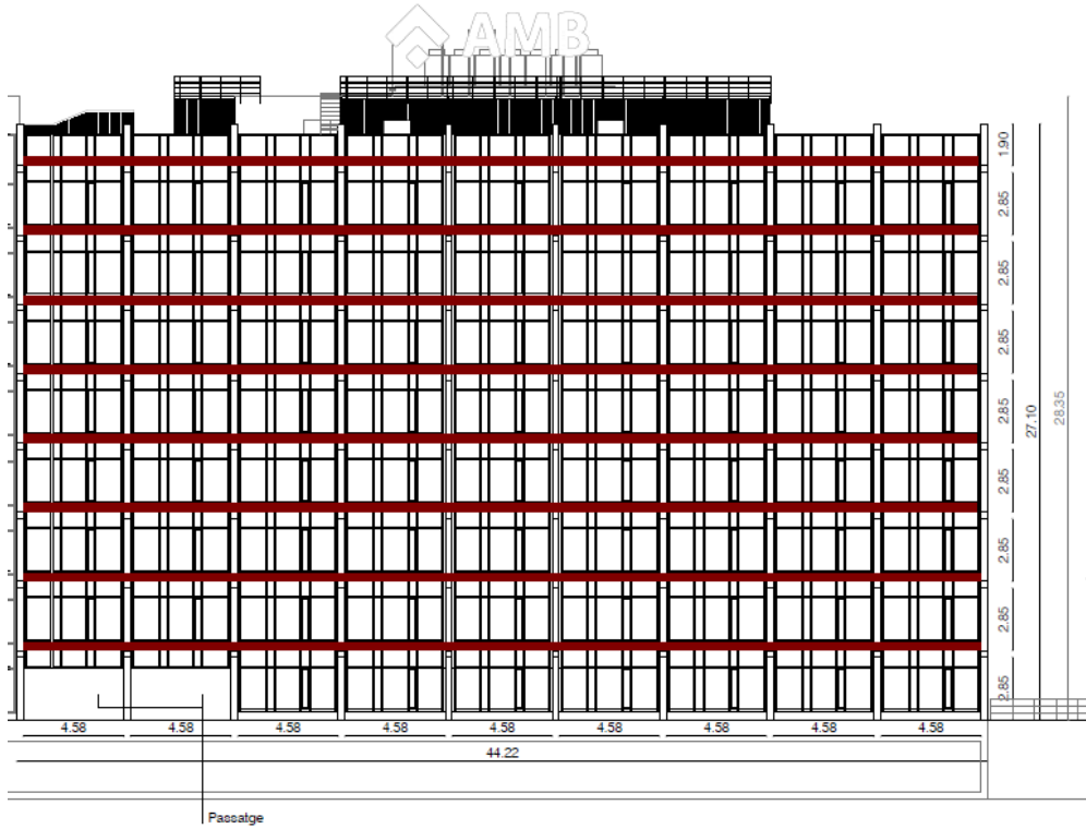
ZONES AMB POSSIBLE PRÈSÈNCIA D'AMIANT