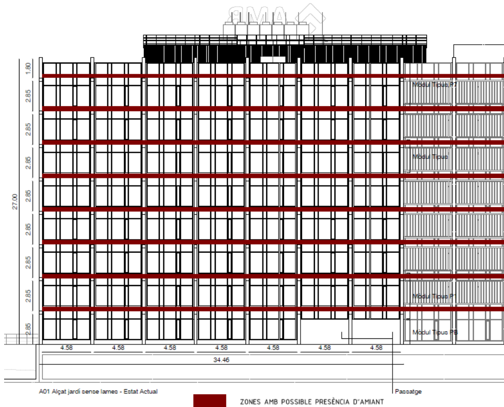
ZONES AMB POSSIBLE PRÈSÈNCIA D'AMIANT

VILLASUR MILLAN, Carles (1 de 1) Cap de Servei Seu social Data signatura : 17/09/2024 14:55:31 PKSHF-905853A5534421F056246BC4EEB876C9011B150