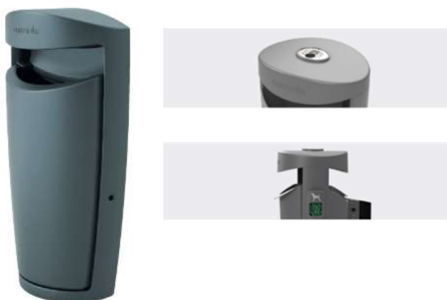
Imatge 1 Fotografia orientativa de paperera de 60 litres i accessoris a adquirir.

-Accessoris de la paperera: cendrer i dispensador de bosses per a excrements de gossos