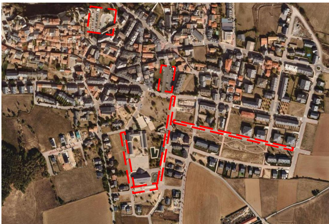
Figura 1: Aparcament previst per als assistents que es desplacin amb vehicle.

L'afluència de vehicles es preveu que serà assimilable a la festa major on hi ha molta afluència a les firetes i altres actes. Per tant no es preveuen actuacions addicionals en matèria de mobilitat.