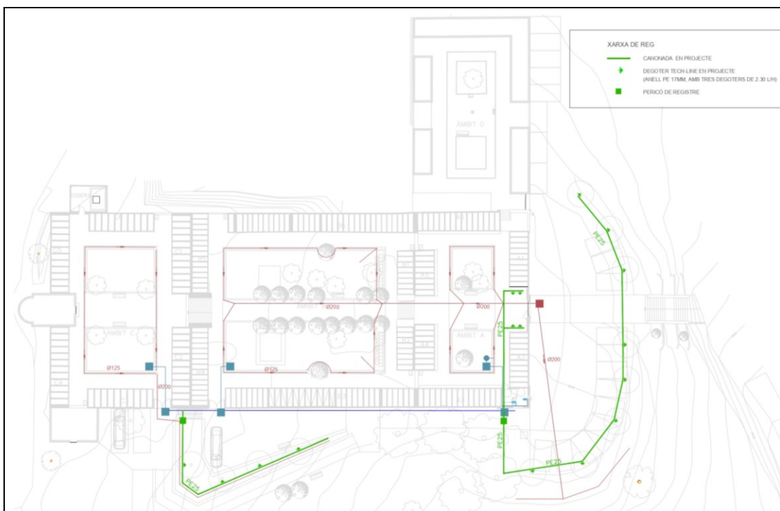
Retall sense escala plànol distribució xarxa de reg