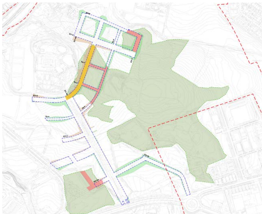
Imatge 1. Delimitació de les àrees de precàrregues i sanejts