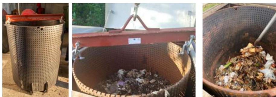
Cilindres metàl·lics de referència al municipi a Les Masies de Roda.

El subministrament contempla un total de 47 unitats el que suposa un import total de contracte de 59.220,00 € (IVA no inclòs), 71.656,20 € (IVA inclòs).