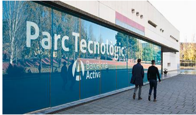
Edifici Parc Tecnològic

L'edifici està format per tres blocs A, B i C, connectats per un passadís al costat sud i un altre al costat nord.