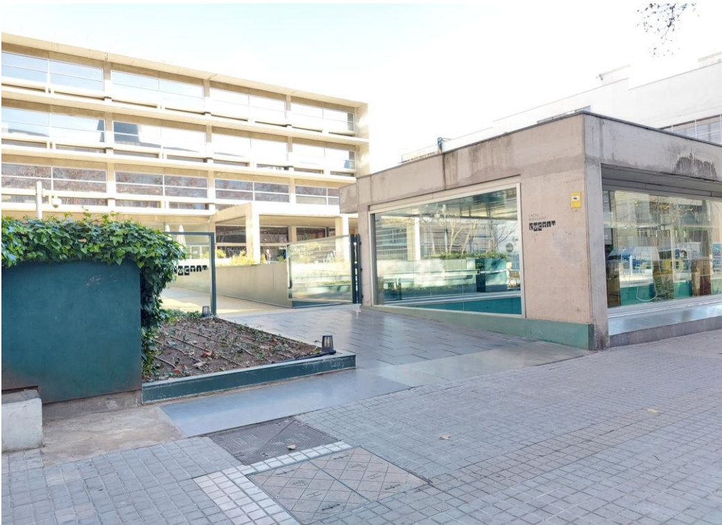
Figura 2: Vista de la Seu Central des de l'accés, costat restaurant.