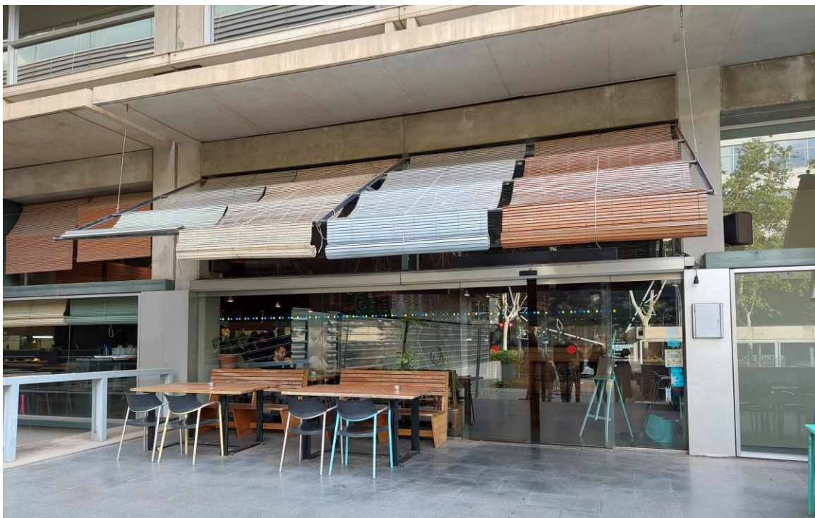
Figura 5: Façana sud-oest Seu Central, zona restaurant, làmina solar només a instal·lar en la part superior, zona darrera les persianes.