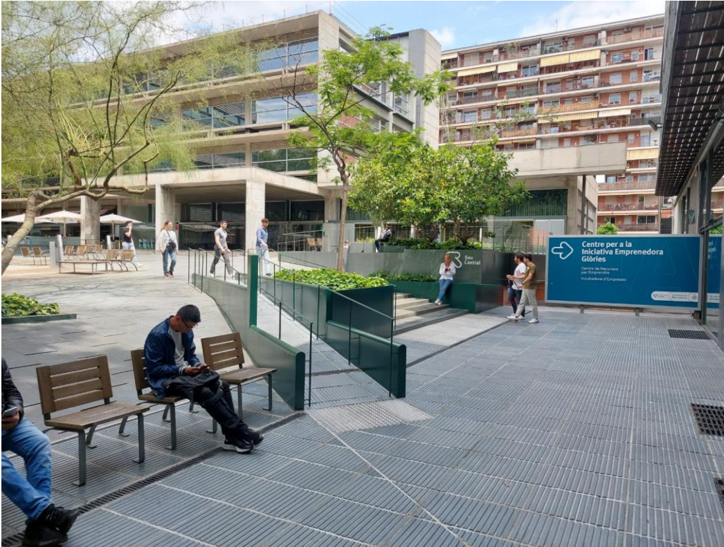
Figura 1: Vista de la Seu Central des de l'accés compartit amb la Incubadora Glòries.