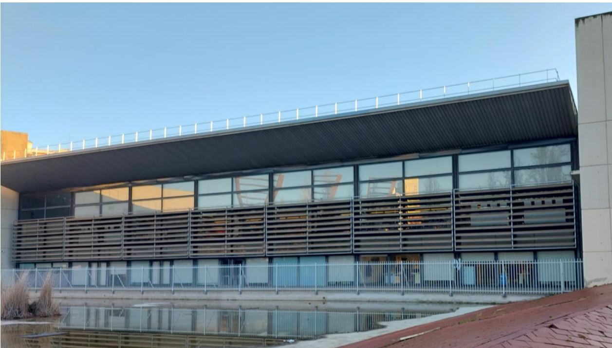
Figura 8: Façana oest Parc Tecnològic