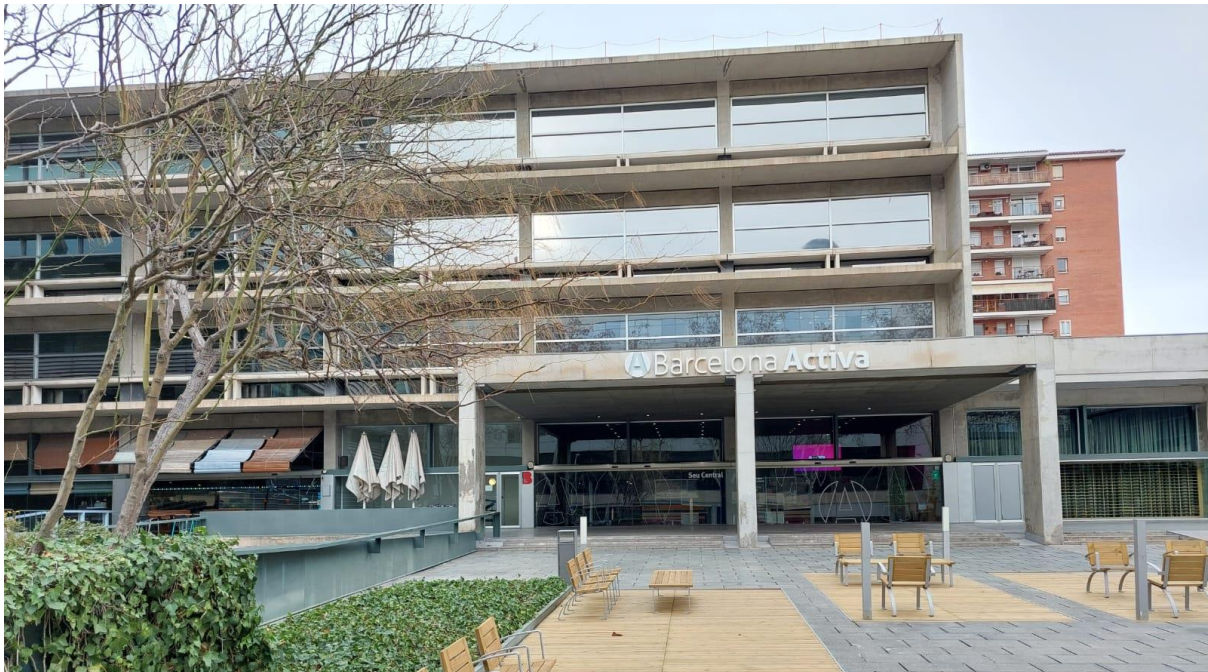
Figura 3: vista general Seu Central, façana sud-oest.