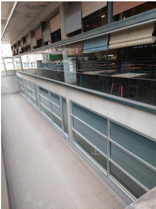
Figura 4: Façana sud-oest restaurant Seu Central.