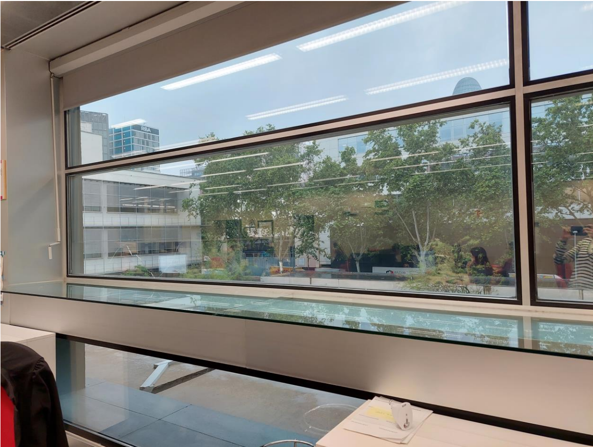
Figura 7: Vidre fissurat a substituir planta pis Seu central.