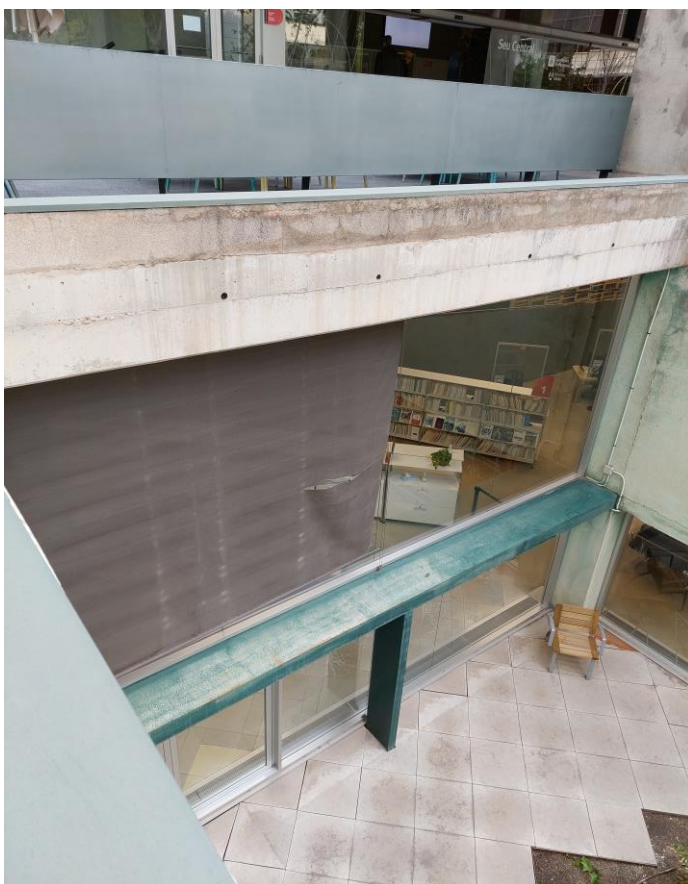
Figura 6: Pati Porta 22, només cal instal·lar làmina de protecció solar als vidres superiors.