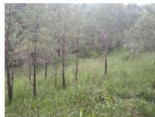
Descripció de foto 2

Estassada de matollar per afavorir el prat