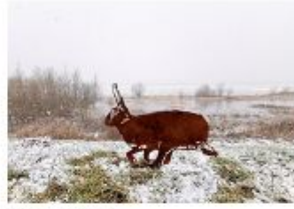
Descripció de foto 2 Model de figura de corten de la fauna