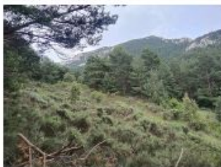
Descripció de foto 1

Fotografies prèvies a l'execució de l'actuació