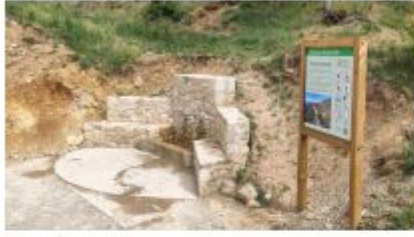
Descripció de foto 1 Font del Vermell, rebuda de visitants