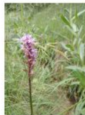
Descripció de foto 4

Dactylorhiza fuchsii al prat i al rierol.