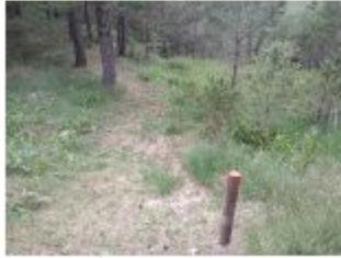
Descripció de foto 3 Fita de seguiment existent