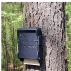
Descripció de foto 3

Tallada d'arbres ubicats al mig del patamoll hidròfit