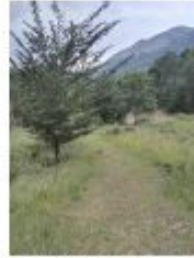
Descripció de foto 4 Cami del Vermell on hi va l'itinerari botànic